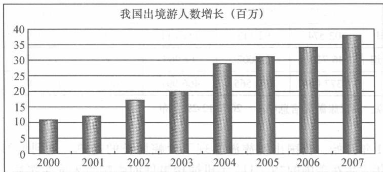
图 1-1 2000—2007 年我国出境游人数增长

新闻传播的迅速发展,得益于两点:一是科学技术。先进的信息载体为新闻迅速传播提供了可能。二是社会交往中的文化积淀。由于不同的立场、不同的观念、不同的心理和不同的文化素养,对相同的信息传播会产生不同的认同感。使认同感趋于一致或相通,是加快信息传播的首要前提。改革开放 30 年来,我国在不断提高人民物质生活水平的时候,在精神文化消费方面也有了长足的发展。不论是文化用纸消费、广播电视的发展,还是打开国门接纳外国游客,都远远地超过了发达国家的发展速度(见图 1-1、表 1-1)。