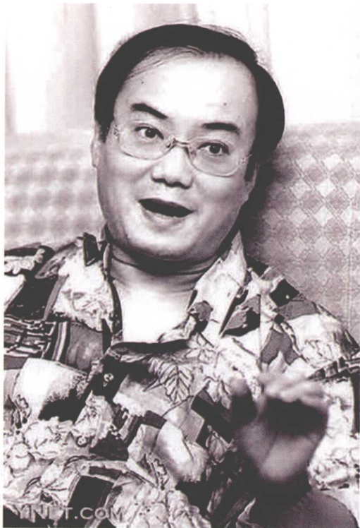
◎ 现年 55 岁的温瑞安英姿飒爽，谈笑风生，他是台湾新武侠的殿军之一，被大陆网友尊称为“温巨侠”。

后《绝代双骄》、《铁血传奇》（即《楚留香传奇》）、《多情剑客无情剑》相继出版，古龙的声望日渐高涨，很快超过了其他对手，成为台湾武侠第一人。70年代开始，借着《楚留香传奇》的余韵，古龙接连发表《萧十一郎》、《欢乐英雄》、《流星·蝴蝶·剑》、《大游侠》（即陆小凤传奇系列）、《七种武器》等作品，每一部都堪称绝品，成为台湾武侠界的一颗颗重磅炸弹，彻底击败了其他对手。至此，虽然还有一些作家在坚持创作，但基本上都过了创作的全盛期，无人能和创造力如此旺盛的古龙对抗。读者们也只认古龙为武侠第一家，其他作家的小说销售量根本无法与古龙相比。