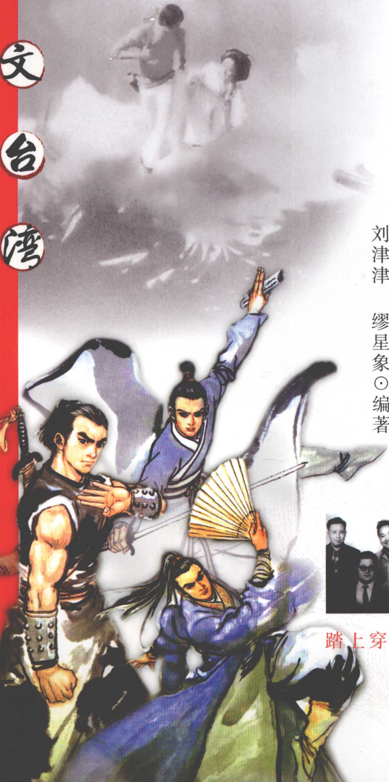
图 文 台 湾