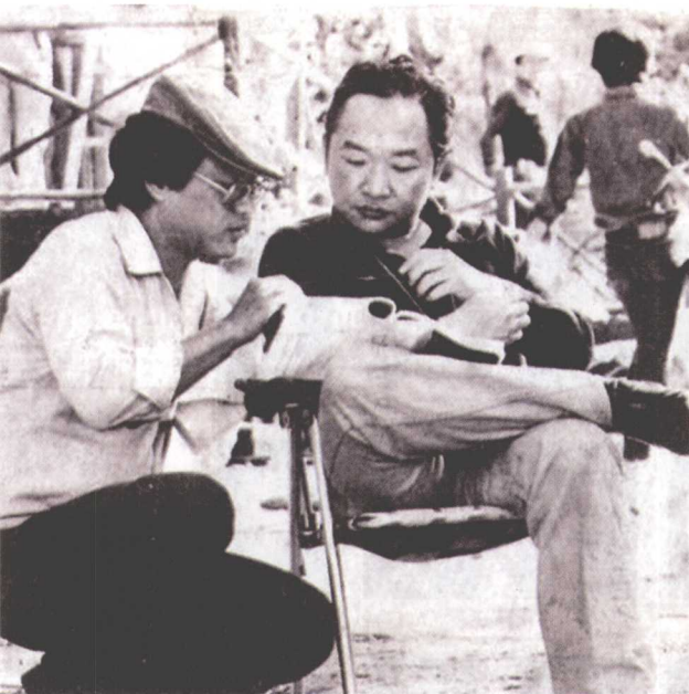
◎20世纪70年代的古龙（图右）在武侠小说界已经获得巨大成功。鉴于当时武侠电影的兴起，1978年古龙组建了宝龙电影公司，向影视界发起冲击，既当编剧又当导演，拍摄《楚留香》、《小李飞刀》等影片。

他对古龙的启迪也不可忽视。柳残阳、云中岳、秦红皆有特色，在文坛上各自称霸一方：柳残阳1961年发表《玉面修罗》，引起关注，而后接连出版《天佛掌》、《泉中雄》、《泉霸》等作品，形成自己铁血刚猛的文风，他吸收郑证因的“帮会技击”传统，虚构出一个正邪纠结、冲突频仍的江湖世界。云中岳则走了一条历史武侠小说的道路，以完整呈现古代江湖社会时空场景为目标。从1963年发表《剑海情涛》开始到1968年《八荒龙蛇》达到顶峰，他的小说将历史真实和文学虚幻结合在了一起，凭借渊博的文史知识将武侠人物还原到历史之中，在描写武林争霸的同时又表现了各地风土人情、历史文化。可以说云中岳