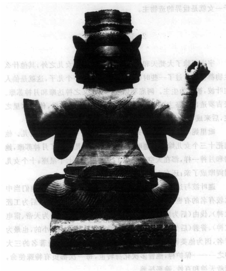
创造者梵天。此图呈现了他四个头中的三个头，他是智慧之神和“吠陀”的保护神。梵天被认为是一般人类特别是婆罗门的祖先，他臂上的圣线是突出的。砂石雕刻，马德望出土，十世纪。