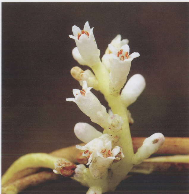
金灯藤 Cuscuta japonica Choisy