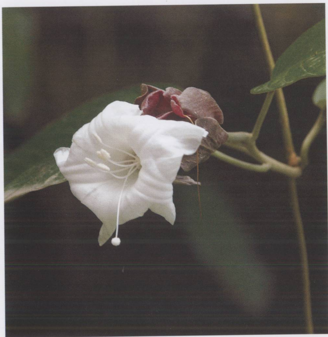
白鹤藤 Argyreia acuta Lour.