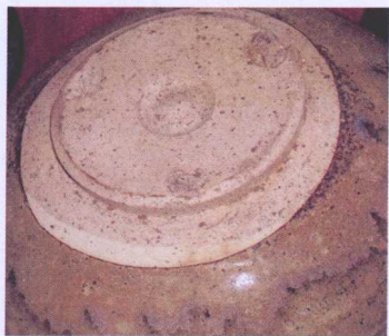
唐寿州窑瓷碗底露胎

早期瓷器的胎土普遍较差，这是必然的。为了解决瓷土质量不高这一问题，许多窑口采用了“化妆土”来给瓷胎上色，改善胎色不净的缺陷。宋代以后的瓷器，虽然胎土能够做到细腻洁白，但为了解决烧制大器或解决釉色的呈色问题，在瓷土的配方上做了许多尝试，有的朝代也出现过某种优质瓷土用尽而不得不改换其他瓷土的情况。一般而言，早期瓷器胎子颗粒较粗，外观比较干酥；元瓷、明瓷的瓷器底足，多露有火石红痕迹；清瓷器底或微有火石黄，摸上去有糯米粉的质感。