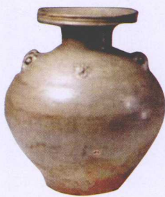
西晋越窑青瓷盘口壶