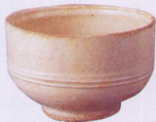
北宋石灰釉钵（广西滕县窑）

明德化窑的白釉，又称之为“中国白”，其发色不同于明代景德镇窑的青白色，这是与两地的瓷土中的氧化钾、氧化硅含量不同有关。明德化窑的瓷土，氧化硅含量高，而氧化钾的含量也高达6%，烧成后玻璃相较多（从瓷片断面看，玻璃质感强），胎质致密，透光度十分良好。从图片