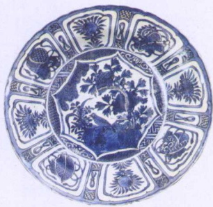
明万历青花盘（克拉克瓷）