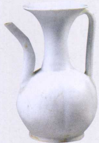
宋青白瓷执壶（长壶嘴）