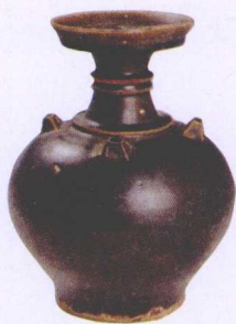
东晋德清窑黑瓷盘口壶