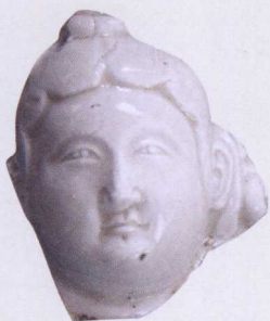
唐曲阳窑（定窑）头像