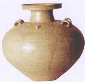
三国吴越窑青瓷盘口壶