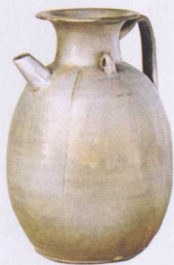
唐青瓷执壶（短壶嘴）