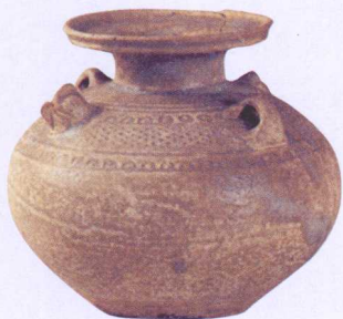
西晋青瓷盘口鸡头壶

此盘口鸡头壶器型和胎釉为典型的西晋器物，其胎釉让人明显感觉到结合得不够紧密，釉汁稀薄，采用刷釉的方式施釉，未能完全覆盖胎子，故有露胎的现象。这些都是早期瓷器的制造特征。