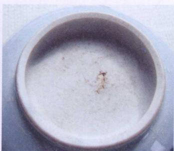
清德化窑瓷碗底露胎

从上面的几个不同时代的瓷碗的底部露胎处，可以看出瓷器的胎质有一个渐进的过程，是随时代进步而进步的。当然，这是一般而言。在偏僻地区，晚清民国，甚至至今仍有一些小杂窑还在生产很传统的瓷器，胎釉都不够好。这一点，要注意。