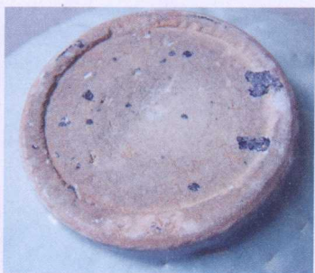
宋南丰白舍窑瓷碗底露胎