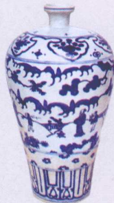
明万历景德镇窑青花梅瓶