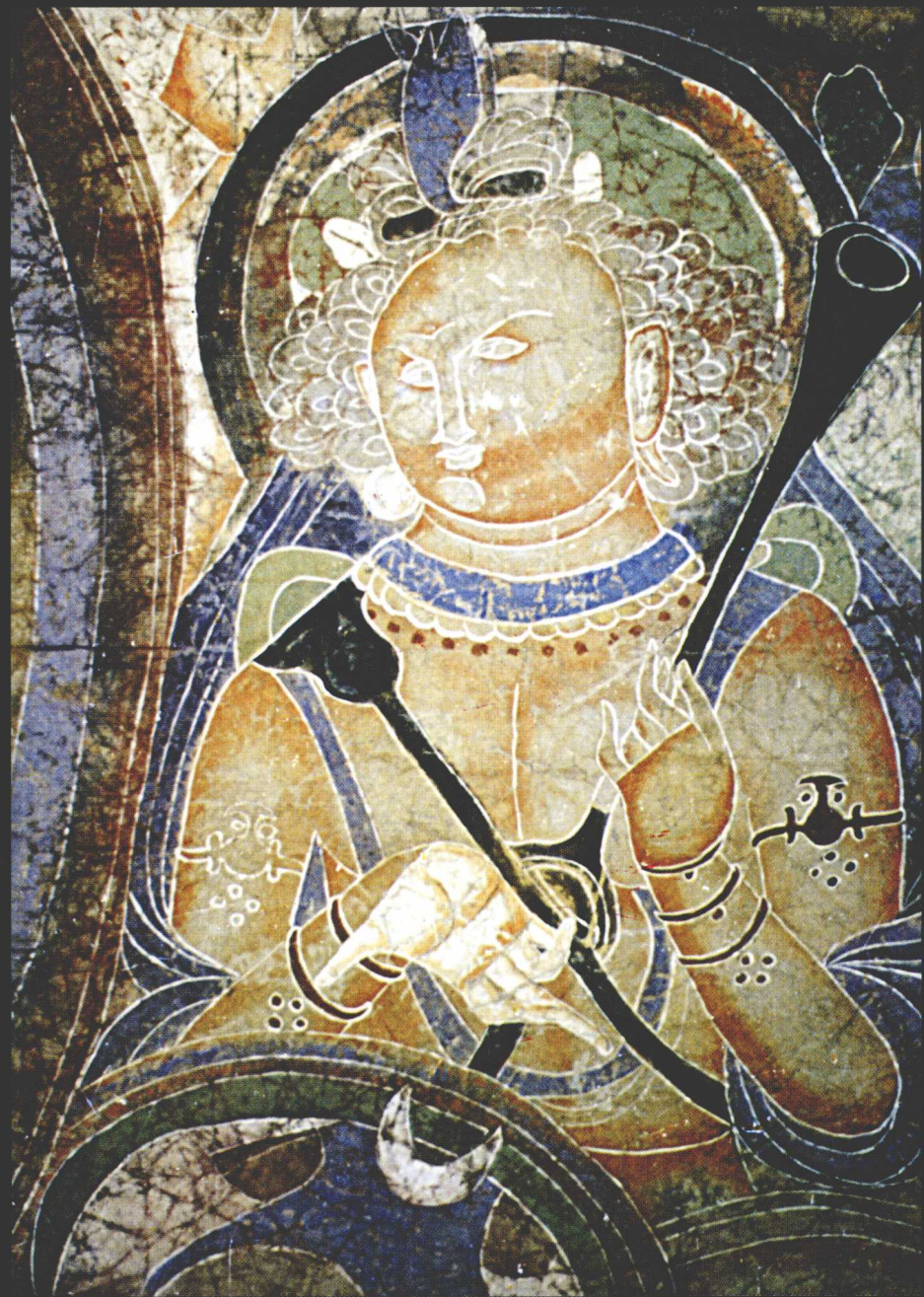
克孜尔 189 窟 “护法金刚”