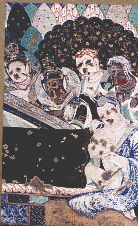
克孜尔 38 窟 “说法图”