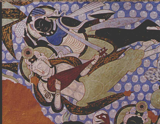
克孜尔 8 窟 “飞天”