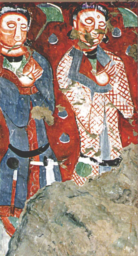
克孜尔 189 窟 “龟兹供养人”