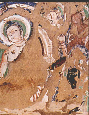
克孜尔 14 窟 “说法图”