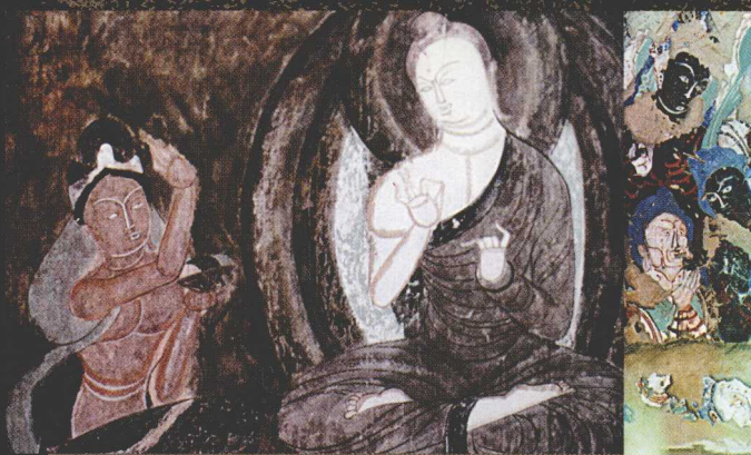
库木吐拉 23 窟 “因緣故事”