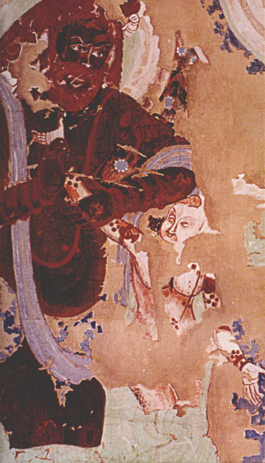
克孜尔 14 窟 “佛传故事”