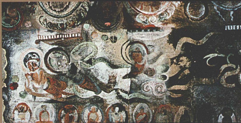
库木吐拉新 2 窟 “飞天”