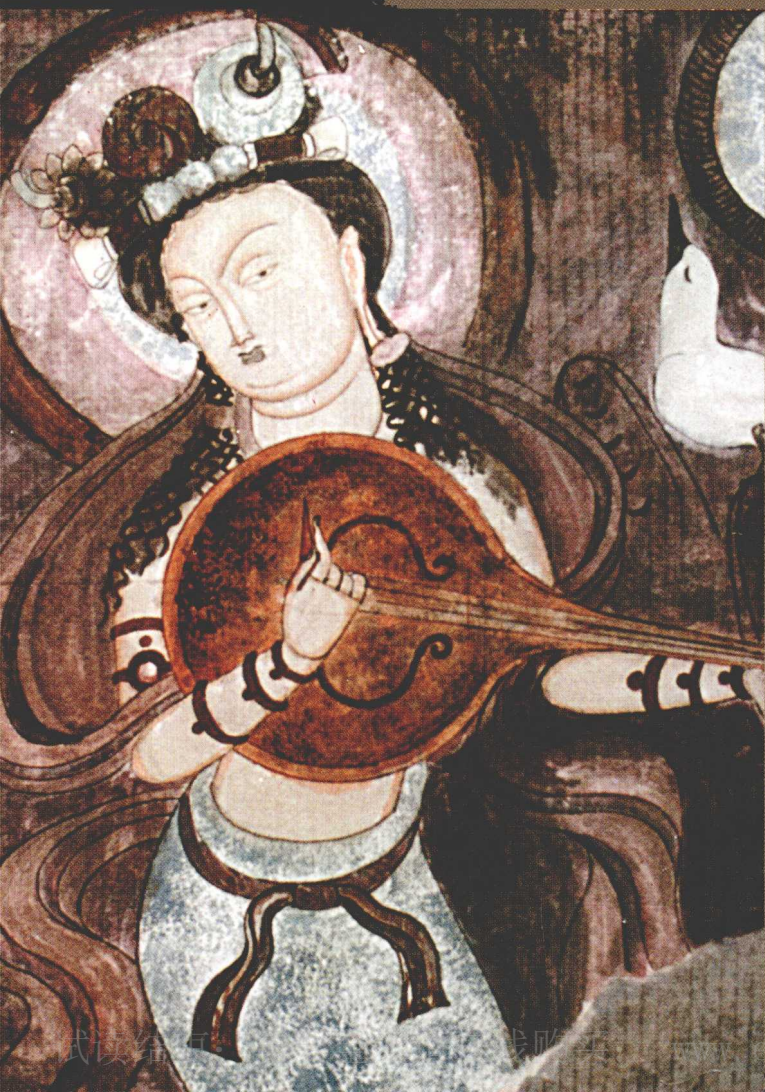
克孜尔 114 窟 “佛传故事”