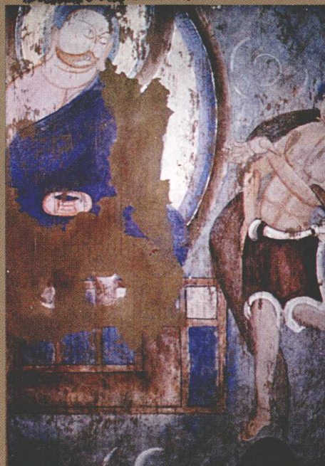
克孜尔 58 窟 “因缘故事”