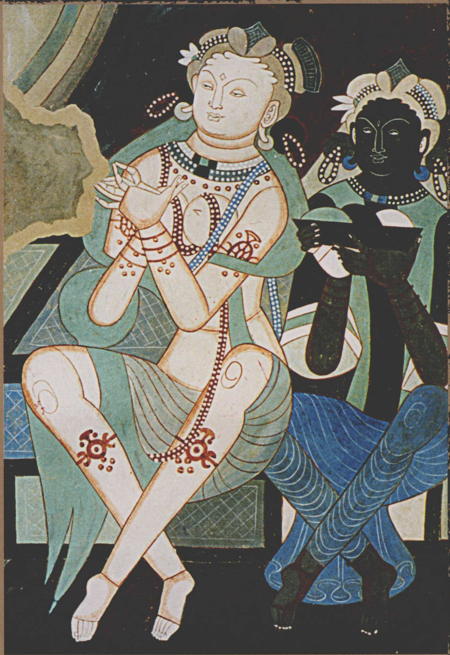
克孜尔 199 窟 “说法图”