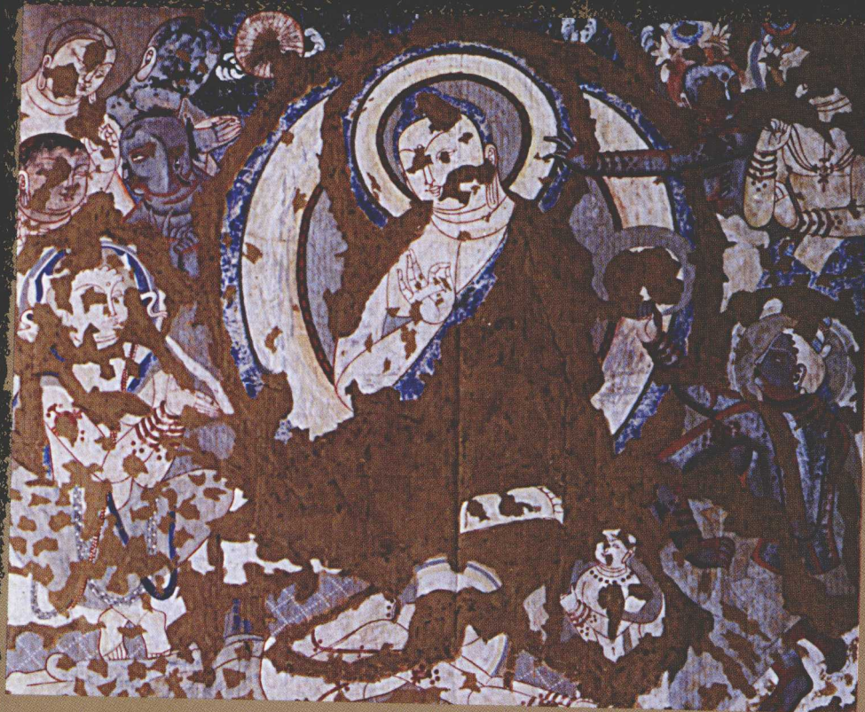
克孜尔 163 窟 “说法图”