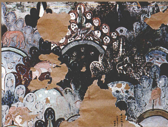
库木吐拉 2 窟 “菱格动物”