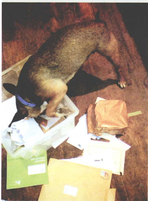
你在自娱自乐，因为没人告诉你做什么。

很快你意识到试图与团队中的其他成员沟通是毫无意义的，而你的老板也会因为你安静下来而感到很高兴。你还未顺从。