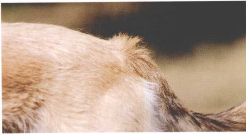
尾巴根部的毛竖起与背部紧张有关。