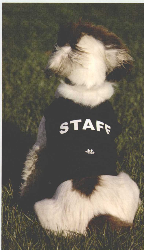
狗狗们想要知道自己扮演的角色。