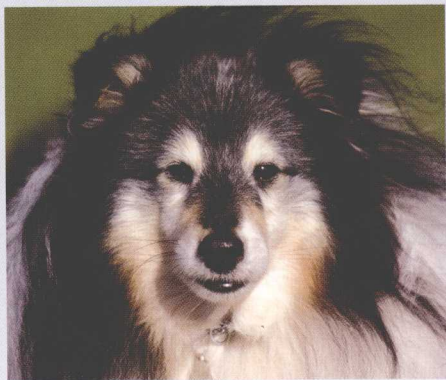
海勒已经11岁了，但仍然喜欢学习新的本领。

越早训练你的狗越好，这样它们忘记的就越少。一些年龄较大的狗仍然愿意学习新的技能，即使是那些被公认为无用的行为。但是随着时间的推移、知识和耐性的消磨，这些本领也将大大地减少。同时年龄大的狗学的比较慢，主要是由于它们身体健康的改变，所以俗话说的好，不教一条老狗新的把戏是不对的。