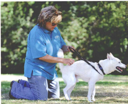
身体后部紧缩的狗很难平静下来而且对这部分区域的接触也会很敏感。

小狗的很多问题可能是由出生时难产而产生的。突发事件、强行控制、拖拉狗的项圈、持续地牵拉狗链、过度的粗暴的翻筋斗游戏等都可以在狗身上建立问题区域而影响它的思想、感觉和学习。