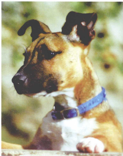
狗通过观察身边所有事物来学习。

那么，所有的训练项目对你和你的爱犬究竟有何意义呢？当然，这取决于你的爱犬曾经学过什么。理想中的“随行”是指你的狗会紧紧跟随你左右，或拴上狗链或不拴；而对于某些狗来说，“随行”意味着它们将用牙把自己牢牢束缚在某一条裤管上。“派离”对于很多人而言是要求自己的爱犬根据暗示找到某个目标位置并呆在那；而对于另外一些人来说则意味着让自己的客人由于被狗穷追不舍而歇斯底里地奔回车里避难。当然，接下来就是“失望”的情绪产生了。但一想到你和你的爱犬亲密无间的关系，这种想法也许就会烟消云散了。