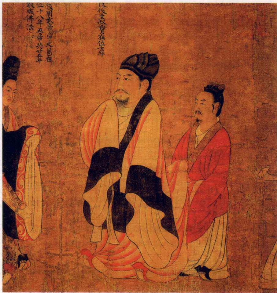
历代帝王图卷之陈后主陈叔宝