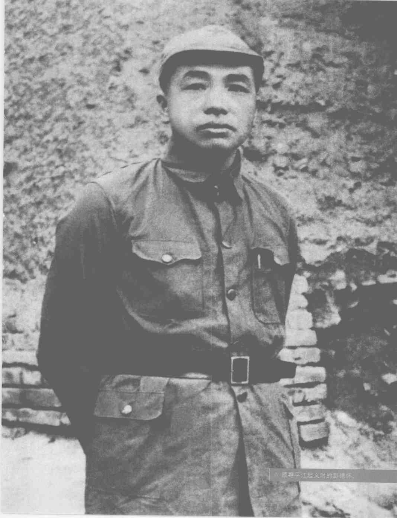
领导平江起义时的彭德怀。