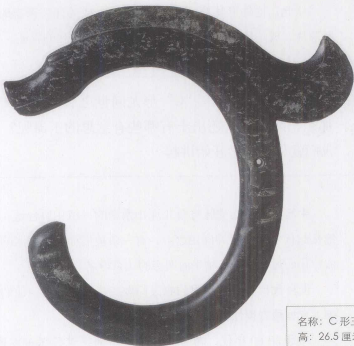
名称：C形玉雕龙 高：26.5厘米 宽：26厘米 年代：新石器时代 级别：国家一级文物 现藏：中国国家博物馆

从这件玉龙的形状，有人推测来源于马、野猪、熊等形象。红山文化玉龙，是多种动物特征的组合。神话了动物形象进行加工的。那么这件玉器是做什么用的呢？许多学者认为是氏族首领在祭祀活动中，进行礼仪活动的神器，巫师通神通天地使用的。玉龙的发现非常重要，是原始文化原始崇拜的表现，反映了早期人们的生活状态。