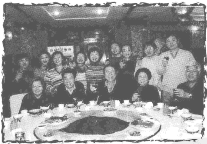
与人教社小语室同仁在一起