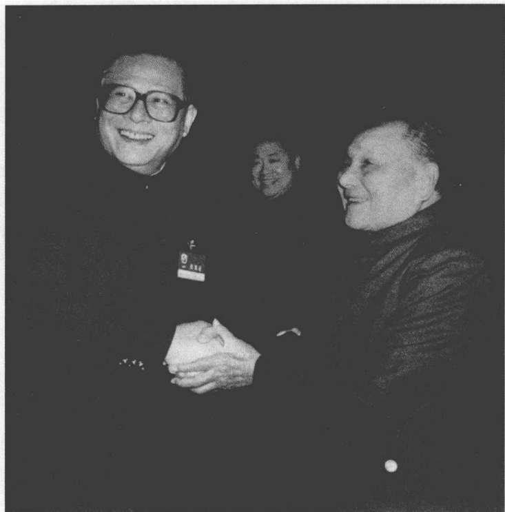
1989年11月9日，邓小平和江泽民亲切握手

当爸一行人走进大厅时，掌声骤起。爸走过中纪委委员的行列，走过中顾委委员的行列，走过全体中央委员的行列。