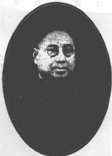
鑽 輝 張