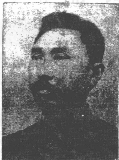
珍 渠 陳