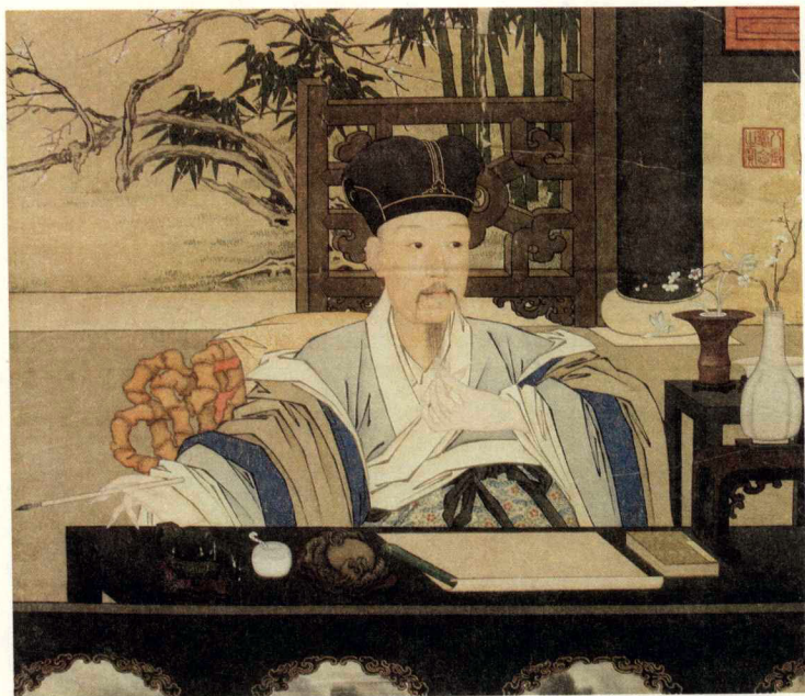
清乾隆皇帝古装像