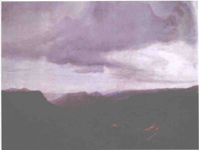
景（局部） 纸本设色 100cm × 300cm 2006