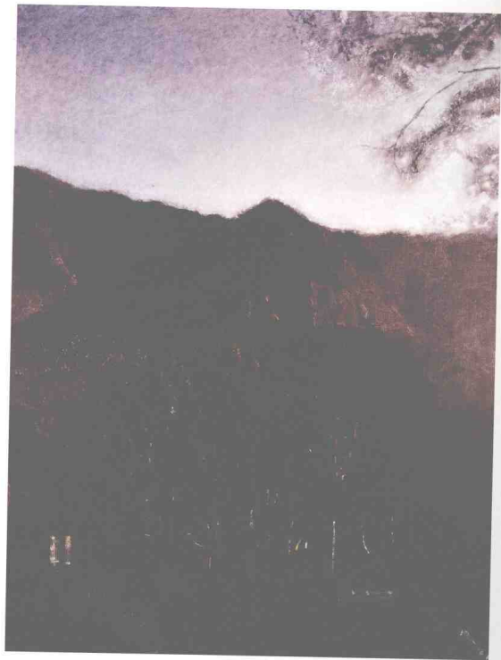
清风明月 布面油画 200cm x 150cm 2006