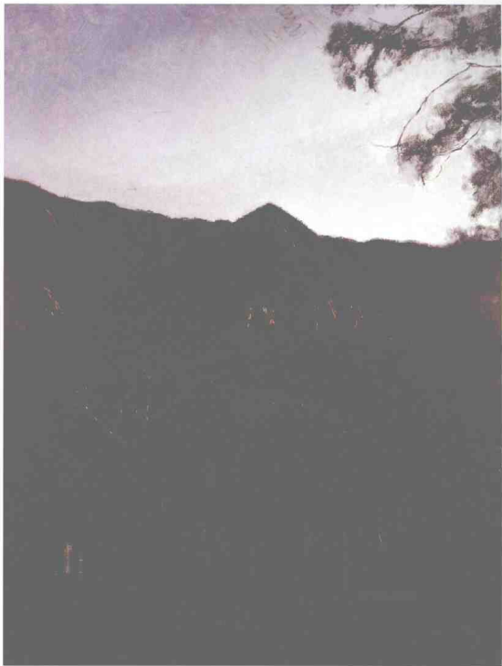
雁荡拂晓 布面油彩 200cm × 150cm 2008