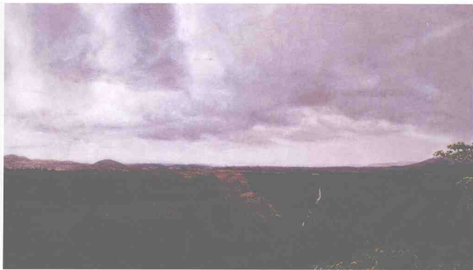
晨 (局部) 布面油彩 100cm × 300cm 2006