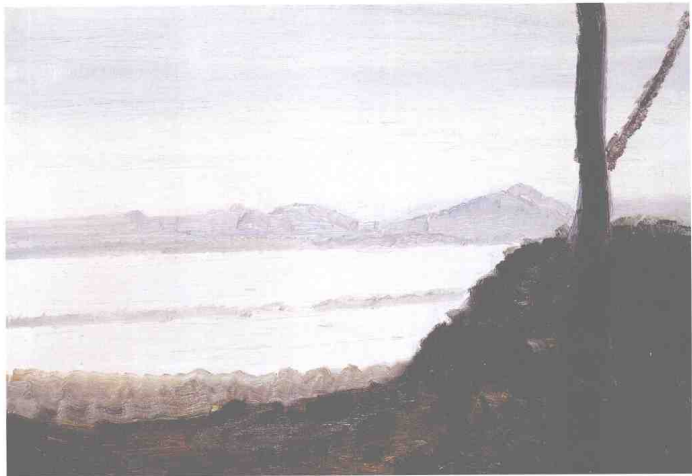
白堤二 布面油彩 80cm x 75cm 2008