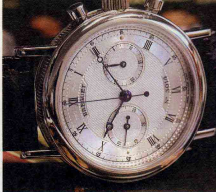
Breguet Ref 5237