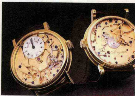
宝玑 7027 古典表

品牌个性： 欣赏宝玑的钟表，就如同在回顾现代钟表业精彩的技术发展史。历经200多年的风雨历程，如今仍然以其深厚的人文精神和优秀的制表传统傲立潮头。