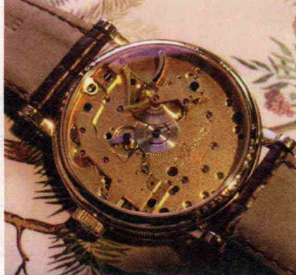
Breguet La Tradition