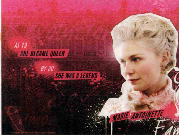
克里斯汀·邓斯特扮演的法国王后玛丽·安东尼，图为电影《绝代艳后》海报。