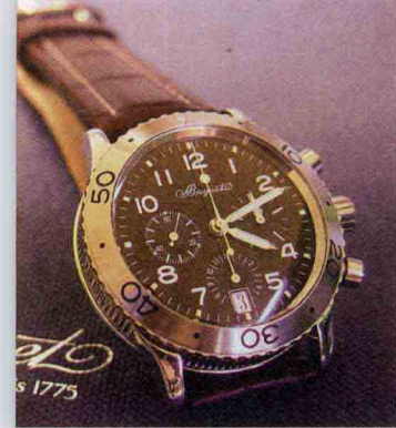
Breguet Type XX Aeronavale Flyback Chronograph in Steel