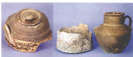
佛山石湾大帽岗第二层出土宋代陶片(宋)