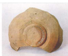
酱釉缸残片(唐) 广东省博物馆藏

明清时期，石湾陶塑风生水起日渐兴盛。其中，石湾陶业二十四行的形成，对石湾陶塑的发展起到极大地推动作用。石湾陶业行会始于明代嘉靖年间(1522年~1566年)。行会以生产的产品类别或工作的分工、地域界限来划分。行会各有行规，“内而厘定行例，以杜内部之哄争；外以树立团体，以杜外部之滥入”，互相之间不准模仿或侵越。最初只分8行，至清末民初增至30多行。除了产品类别的行会外，还有如制釉、砌窑、担泥、落货等行会。每个行会均有自己的堂名。人们习惯称的“二十四行”(如下图所示)指以产品类别划分的主要行会。行会的出现，证明了石湾明清时期陶瓷生产已经逐步进入规范化的经营。