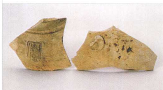
“政和六年”残片(宋) 广东省博物馆藏