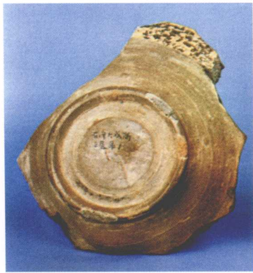
佛山石湾大帽岗第三层出土陶片(唐) 广东省博物馆藏