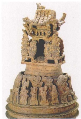
酱黄釉高身陶坛(局部)(唐) 广东省博物馆藏

在大帽岗先后发现了宋代窑址和唐代窑址，出土了不少唐宋时代的日用陶器碎片，而在石湾镇内却未见唐代以前的陶片。奇石村和石湾镇陶业的兴废原因，大概是由于石湾河的河道淤浅所致，宋代以后佛山市成为南北江航运的转运站，同时佛山的手工艺生产和商业发达，所以在明代佛山成为全国四大镇之一。石湾毗邻佛山，水路交通比较方便，所以石湾遂成为广东陶瓷生产的中心。据《广东文物》记载，“石湾陶业全盛时期，共有陶窑一百零七座，容纳男女工人六万有余。而衰落时期(民国年间)，仅余陶窑六十余座，执业工人不及