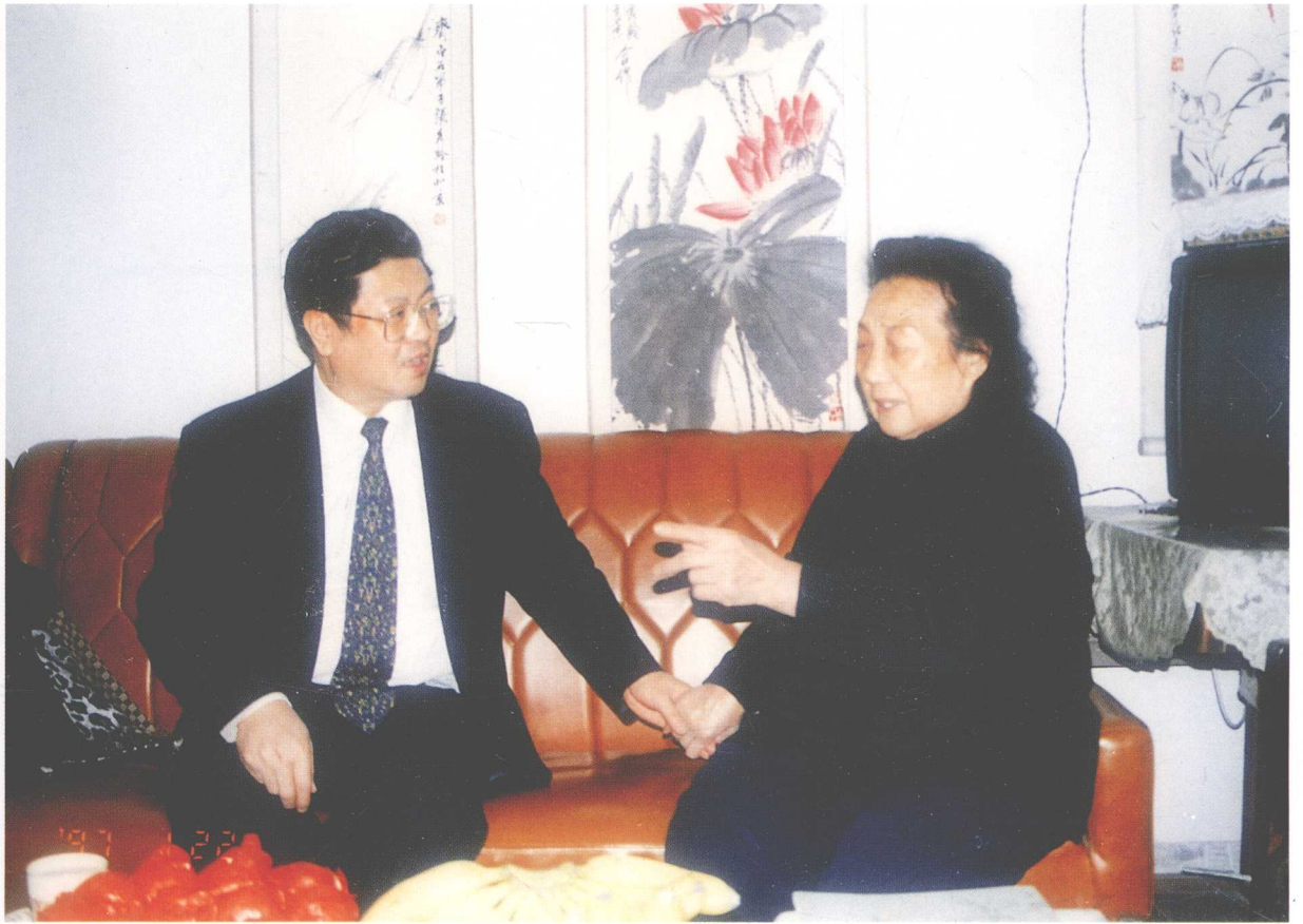
全国政协副主席、中共中央统战部部长王兆国关心老一辈画家张秀龄女士