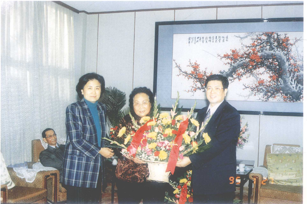
中共中央统战部部长王兆国、副部长刘延东与张秀龄女士合影