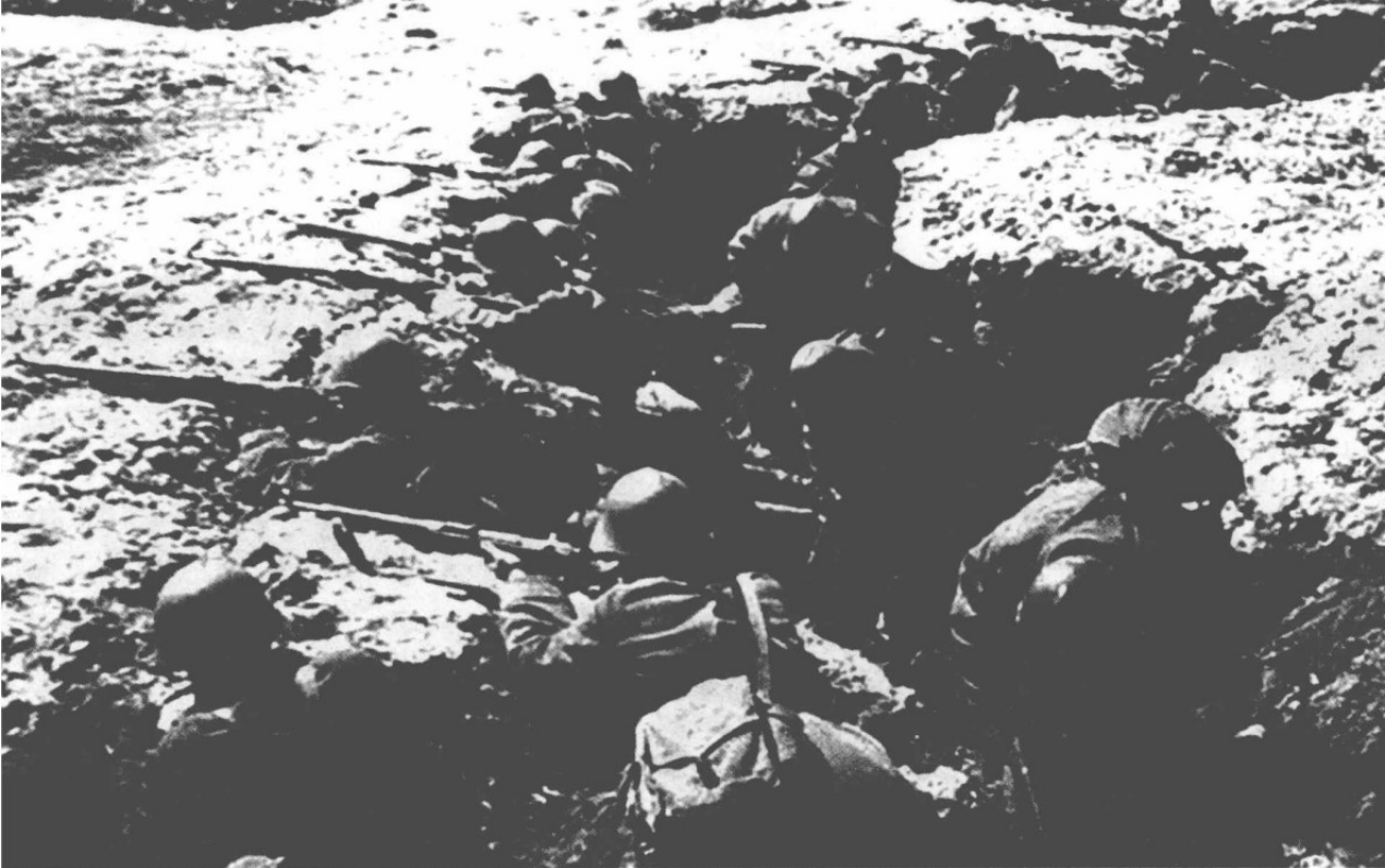
▲ 在防御工事内作战的苏军。

由于后边有尾追的德军,各集团军有组织地撤到新阵地的任务很难完成。同时,在新阵地,只有科罗斯坚、沃伦斯基新城、列季耶夫等筑垒地域适合防守,那些地方的火力配系基础早已建立。一旦部队进驻,那些筑垒地域的防御力将大大提高。在其他新阵地,既没有修筑防御工事,也没有守备部队和军事仓库。所有的防御准备都必须从头做起。