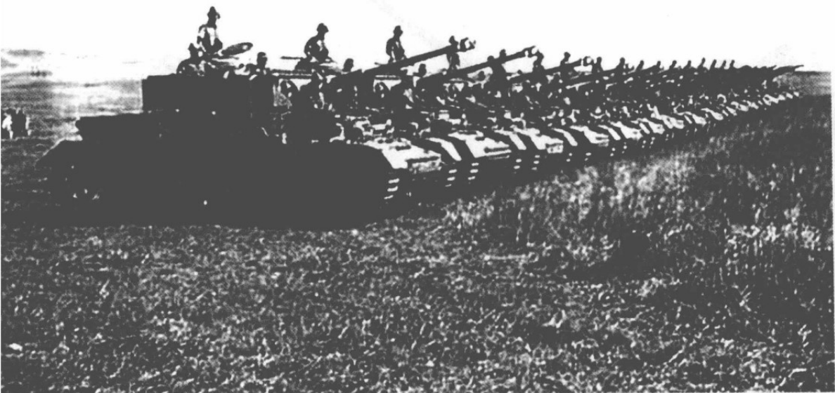
▲ 德军坦克列队等待出发命令。

15军各先头部队遭遇,发生战斗。这支德军装甲部队拥有约350辆坦克,苏军的一个坦克营和摩托化步兵营勇敢地抗击着他们,击退了他们的多次进攻。在这片战场上,德军损失了20多辆坦克,扔下几百具尸体。