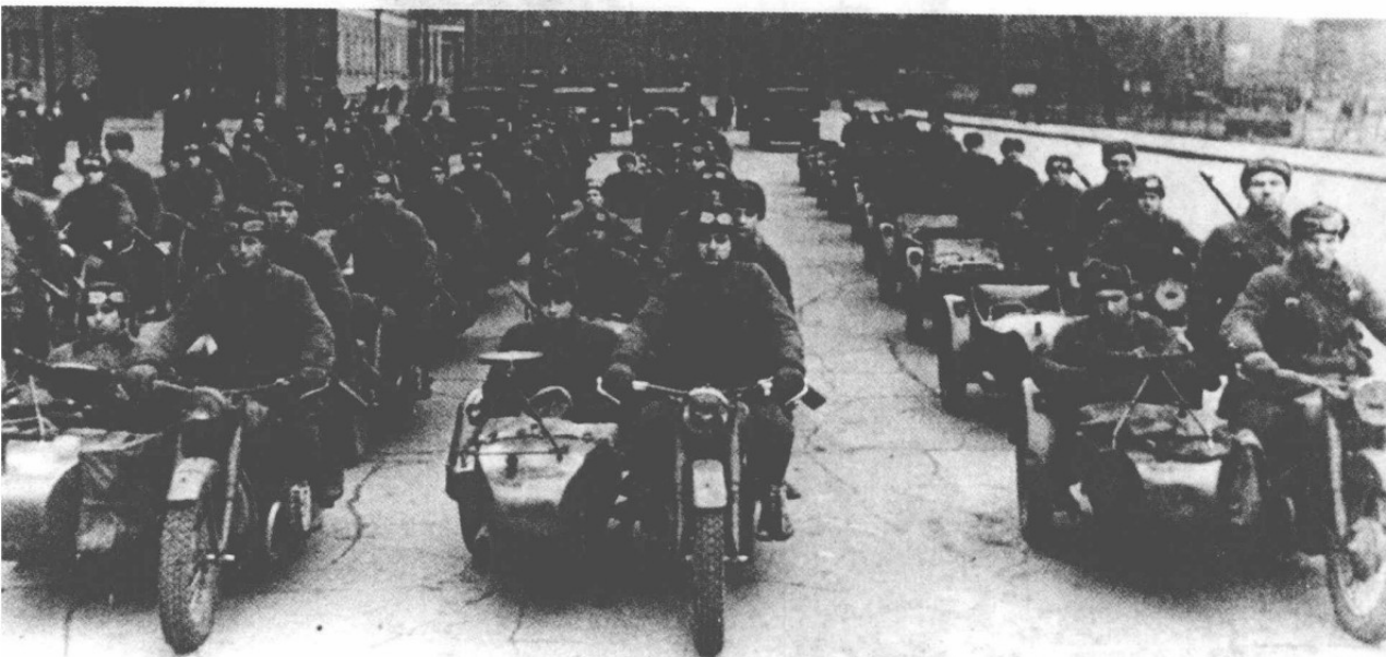
▲ 西南方面军的摩托步兵师。