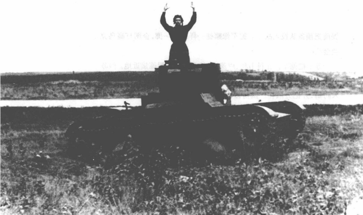
▲ 苏联 T-26 轻型坦克。

苏军在卢茨克方向的局势进一步恶化，德军装甲部队正向杜布诺、布罗德地域快速突进。基尔波诺斯立即下令：“机械化第 9、第 19 军赶往杜布诺，由第 5 集团军司令波塔波夫统一指挥反攻作战，反攻定于 6 月 26 日上午 9 时实施。反攻计划为：先以重兵反攻南面的拉泽胡夫的德军，再转头反攻卢茨克接近地的德军。”