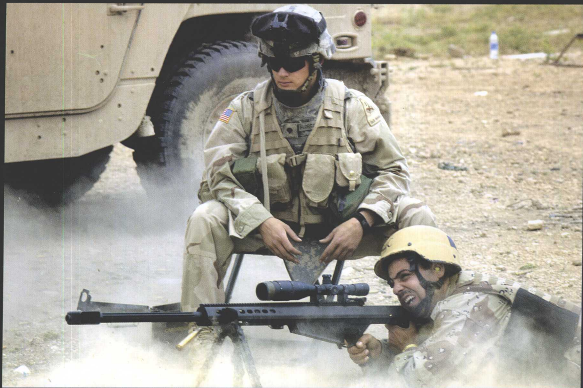
伯莱塔 M107 型 12.7 毫米重型狙击步枪