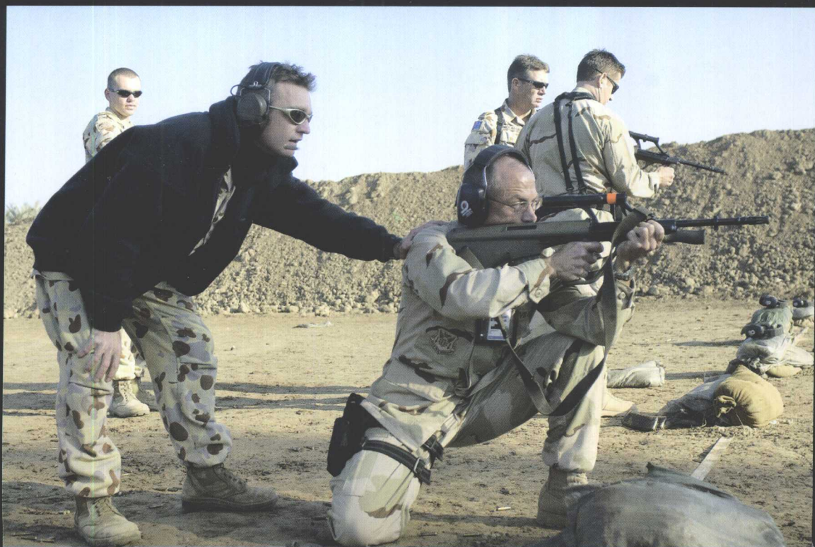
斯太尔 AUGA1 型 5.56 毫米突击步枪