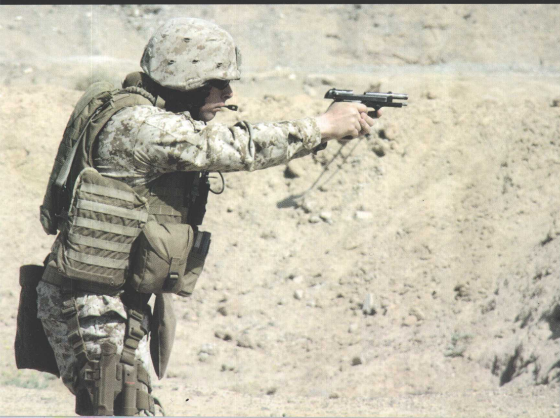
伯莱塔 M&M 型 6 毫米手枪