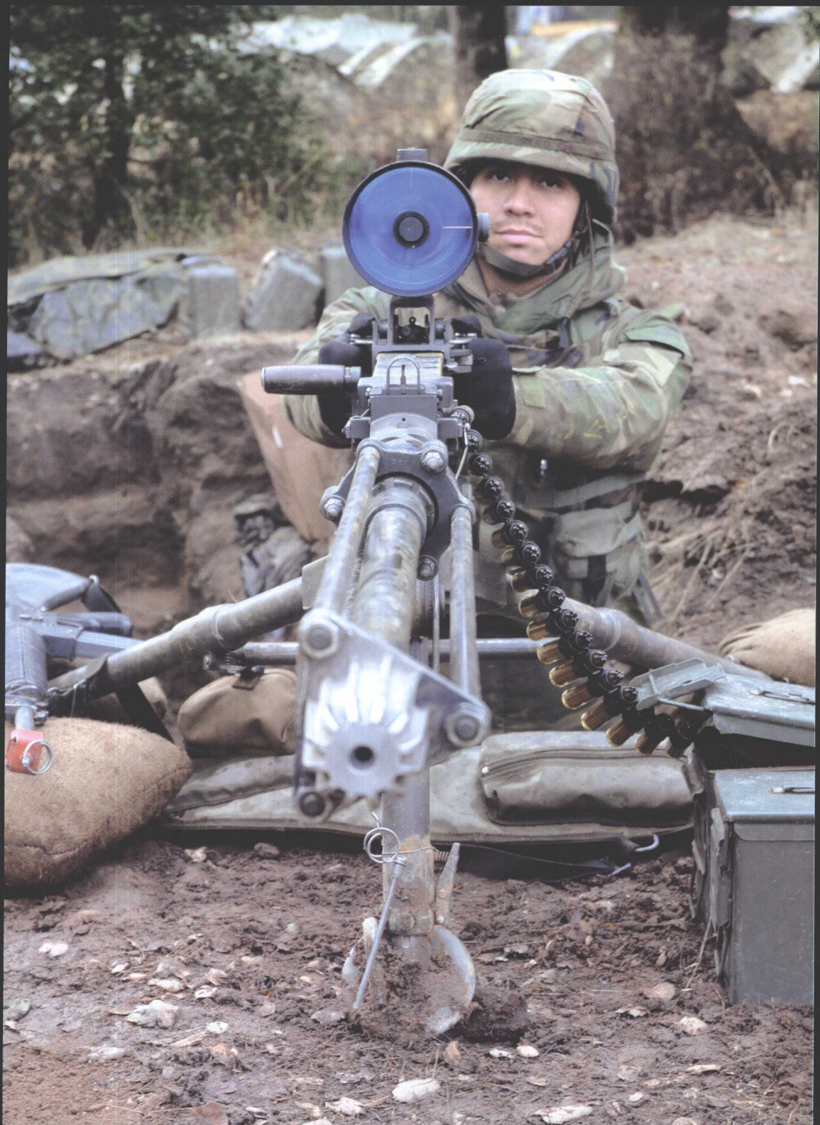
勃朗宁 M2 型 12.7 毫米大口径机枪