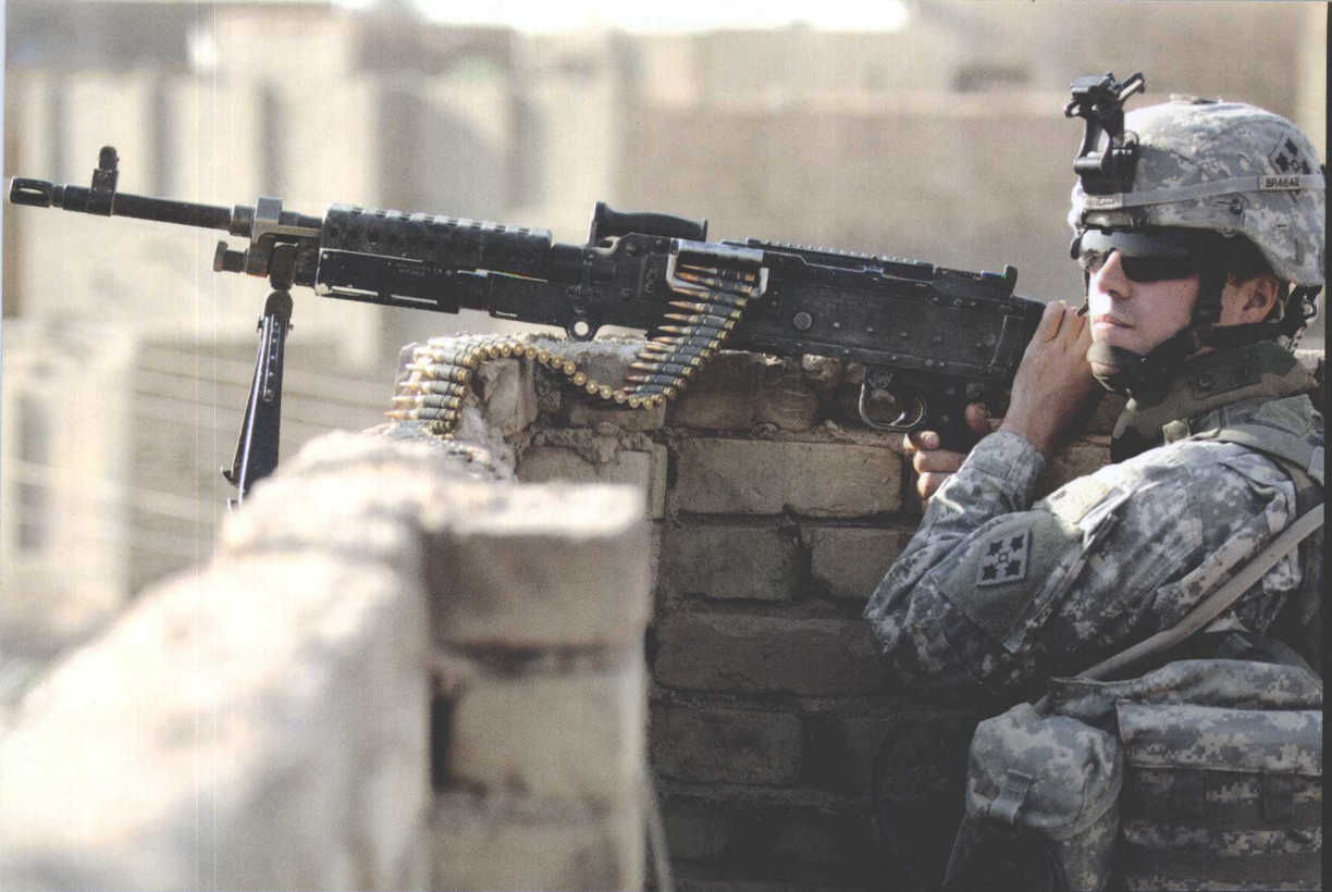
M240B 型 7.62 毫米机枪