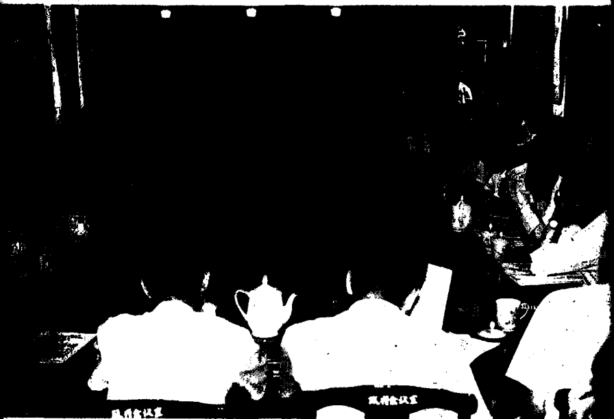
专家学者在研讨会上热烈发言