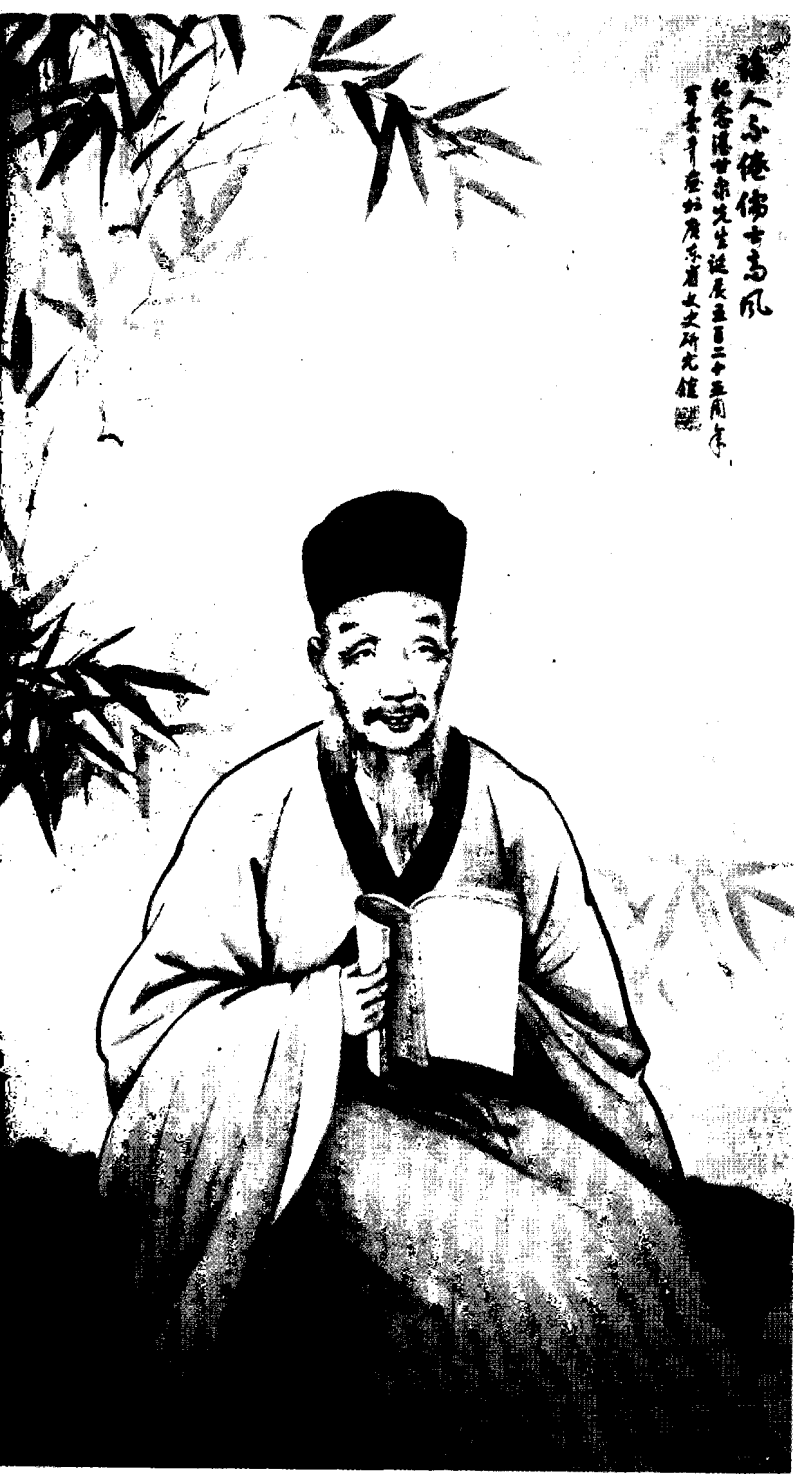
湛甘泉像 关曼青绘