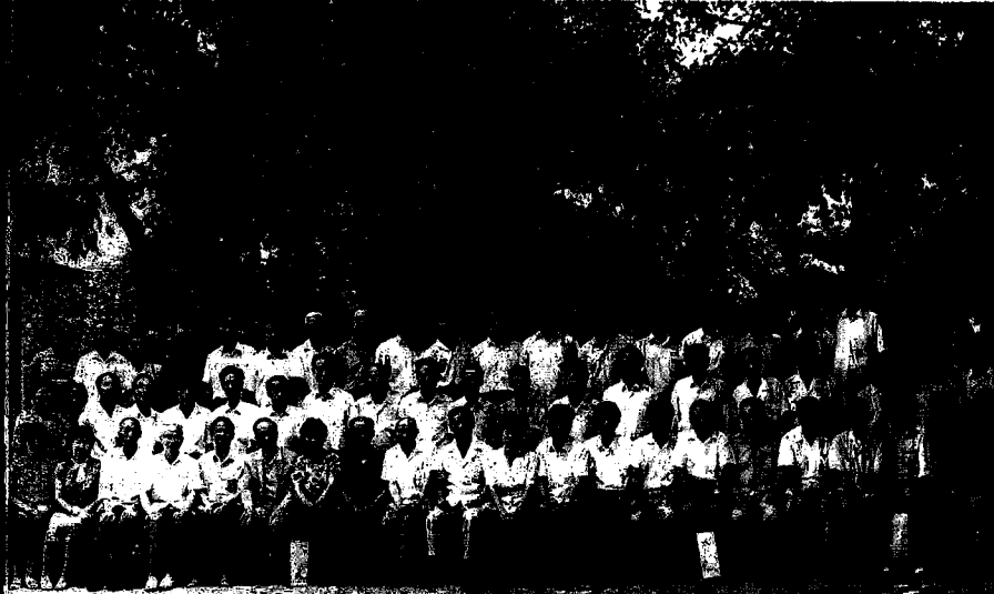
“纪念湛甘泉先生诞辰 525 周年 学术思想研讨会”与会者合影留念。