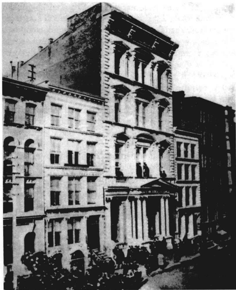
与证券交易所毗邻的黄金交易所，1863年。