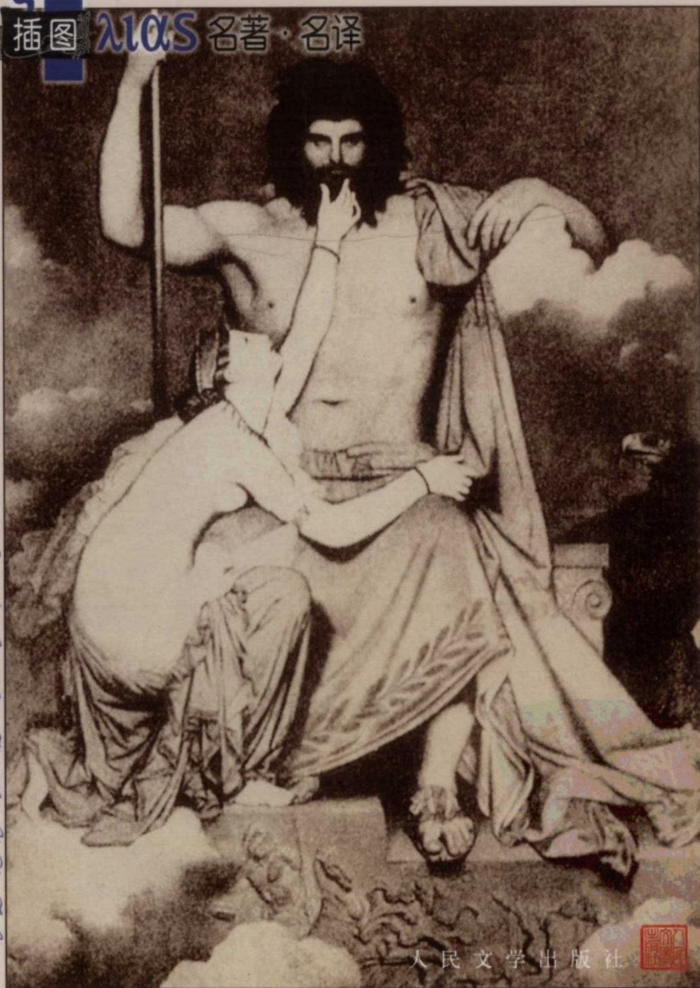
插图 λίσ 名著·名译