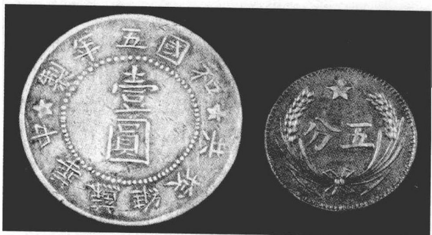
根据地流通的货币

1912年秋，在长沙省立图书馆自学的毛泽东，常驻足于图书馆大厅墙上挂着的一幅《世界坤輿大地图》前出神。这个山村青年，原以为湘潭县就很大，湖南省大得不得了，中国更是大得称为天下，谁知从地图上看来，中国只是一小块，湘潭县更是连影子也找不到。这么大的世界，这么多的人生