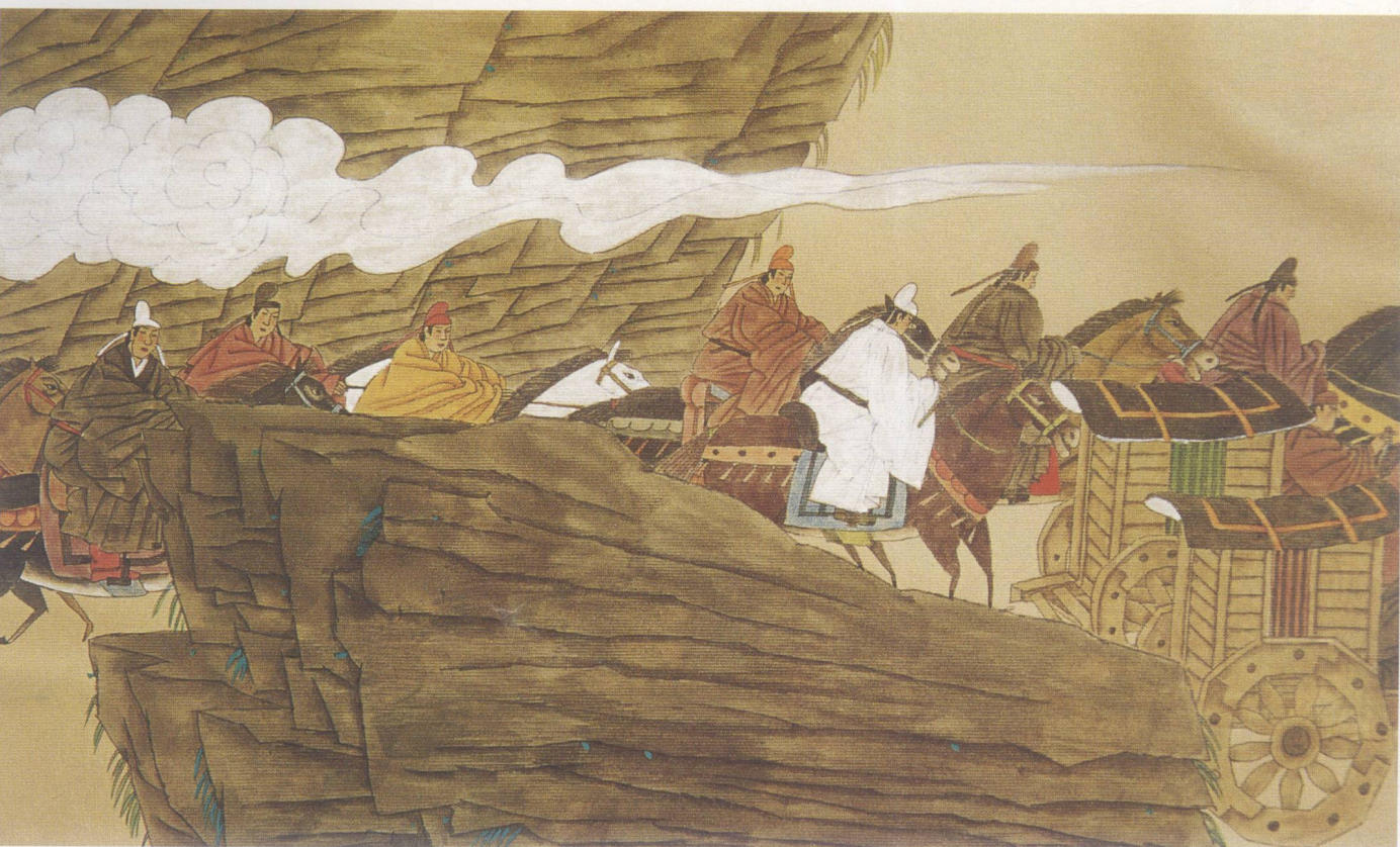
光明净土——峨眉山 2003年 纸本 68cm × 136cm

这是一套连环画中的几幅，画家充分发挥中国画线条的特有魅力，线条组织优美、流畅，有较强的节奏美、形式美与装饰美。选用带横状纹理的色卡纸，用透明颜色，薄薄地上了一层，画面轻快、和谐、自然。