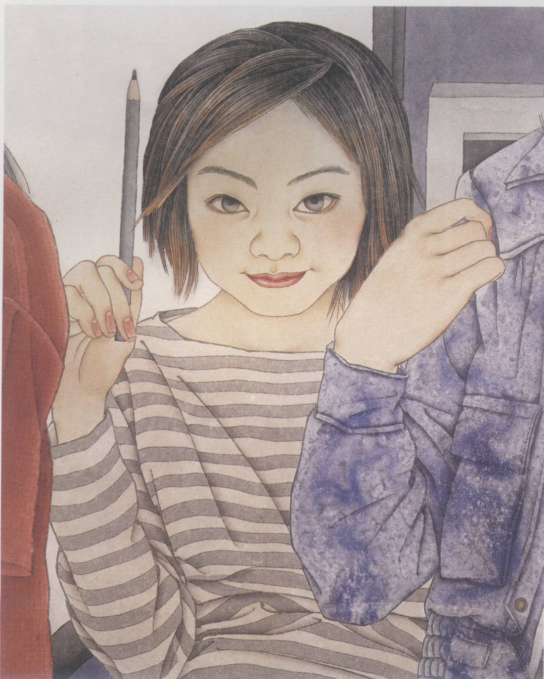
网络人 2003年 纸本 120cm × 173cm