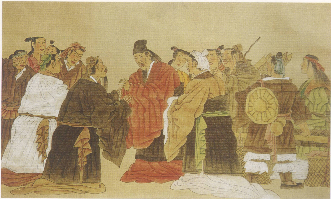
塬上雪 (右图) 1994年 纸本 160cm × 120cm

此作是以青少年为题创作的作品中的一幅，曾入选“第八届全国美展”。画面采用垂直线的形式分割画面，以俯视的角度，使塬上显得异常寂静空旷，突出了塬上寒冬大雪纷飞的场面。布满洁白积雪的小路上，一群少年正踏雪赶往学校上学。在此作中，画家尝试采用生宣纸作画，塬上荒草用小写意笔法，人物局部涂有胶矾水，采用工笔淡彩画。画面蓝灰色调，较好地表现了寒冬的气氛。