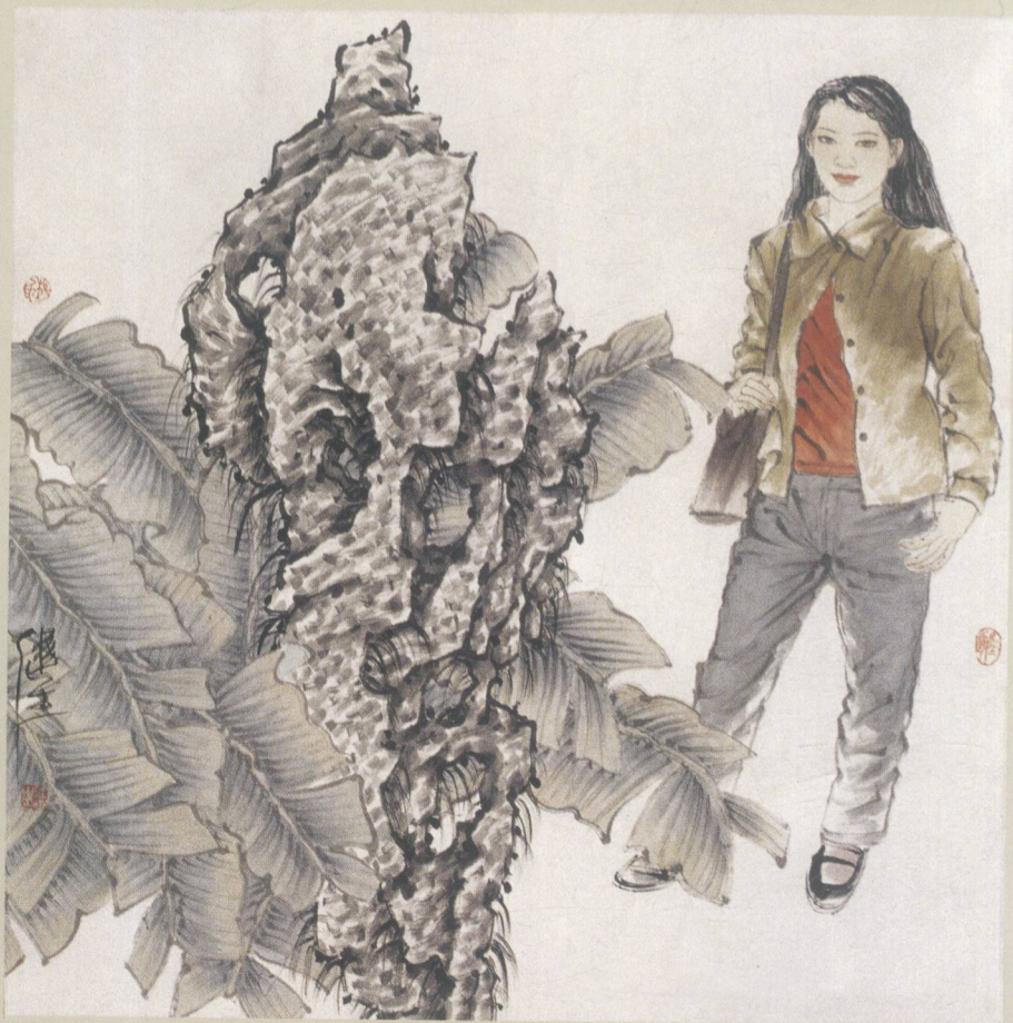
如歌季节 2002年 纸本 68cm × 68cm