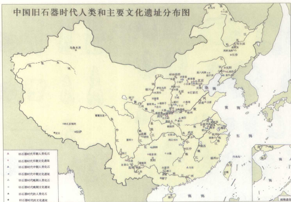
● 中国旧石器时代人类和主要文化遗址分布图

时代上较蓝田人更早、生活在匭河地区的人们来，已经掌握了更进步的技术。匭河及周口店两地的石器都是打制的，而且多半没有经过第二步的加工处理，而北京人的石器比匭河地区出土的石器打制得较规则。在石器的第二步加工方面，周口店的石器也比较精致，制成的样式也比较复杂。一般说来北京人制造石器，不论是打击石片或修整工作，都有一定的方法及步骤。制成的石器依形制及打制技术大约可以分为四类：偏锋砍伐器、中锋砍伐器、石片器及石核器。至于匭河居民所使用的三棱大尖状器、石球以及蓝田人的大尖状器，则北京人没有制造。北京人居住的洞穴中还出土有不少击碎的兽骨残片，他们是否已经制造并使用骨器，还不能确定。