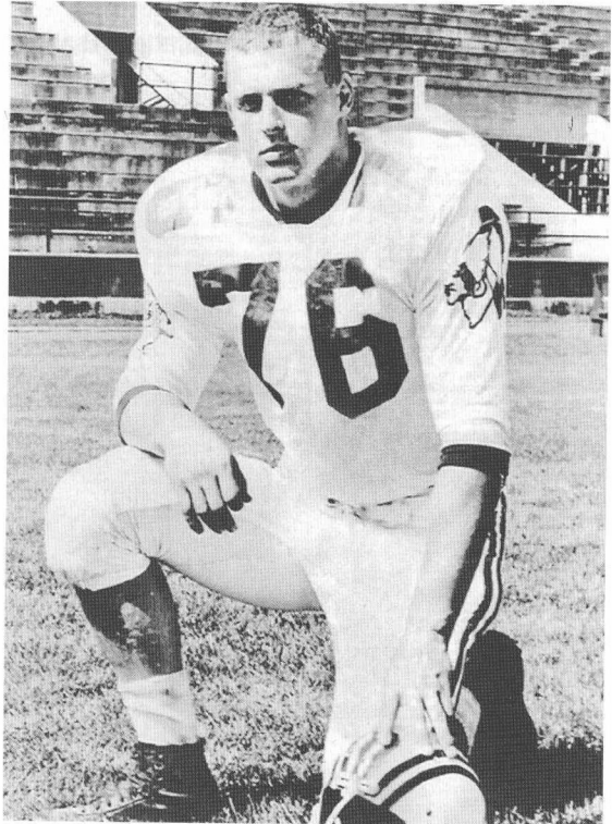
常春藤联盟明星，东部联盟明星 达特茅斯校队内边锋