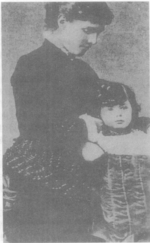
▲1874年11月30日，温斯顿·丘吉尔出生于这个英国的贵族家庭。这是两岁时的丘吉尔和他的母亲詹妮·杰罗姆。

因为他的伯父乔治·丘吉尔、在礼仪上被称为布伦德福德侯爵的未来的马尔巴罗公爵八世只有一个儿子，万一有个三长两短，那么马尔巴罗公爵爵位和领地就该由温斯顿·丘吉尔继承了。在二十多年的漫长时间里，一直存在着这种可能性。因此，在马尔巴罗公爵九世娶妻后，老公爵夫人——温斯顿的祖母即对九世公爵夫人——一位有名的美国百万富翁的女儿康苏埃拉·范德比尔特说：“您的主要任务是生孩子，而且应该生儿子。不能让这个早产儿温斯顿继承公爵的爵位。”九世公爵夫人令人满意地完成了老祖母交给的任务，也使温斯顿失去了成为马尔巴罗公爵的可能性。但人们绝不会为此而替温斯顿·丘吉尔感到遗憾。显而易见，如果温斯顿做了公爵，英国历史上就会少了一代杰出的首相。对温斯顿本人而言，他建功立业，青史留名的向往可