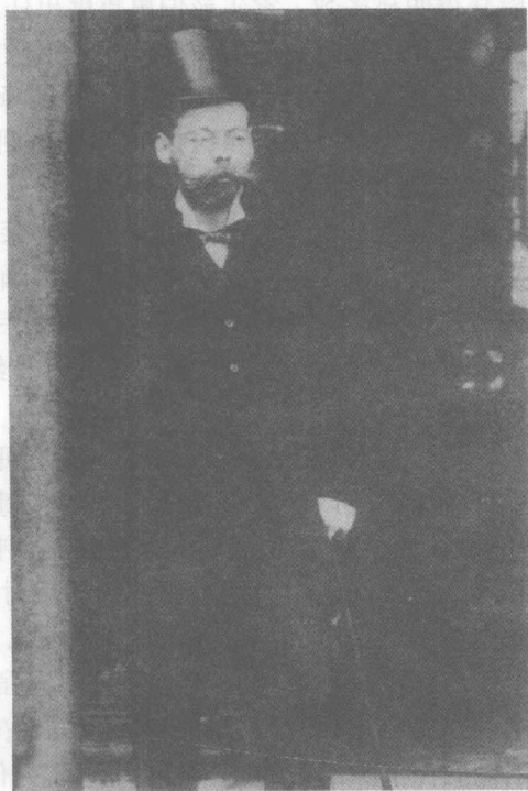
▲1893年,丘吉尔的父亲伦道夫·丘吉尔勋爵。

虽然保守党领导人对伦道夫·丘吉尔采取了忍让态度,但他们始终对伦道夫抱有戒心;对他的野心