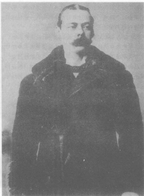
一、巴尔巴罗公爵的子孙

中都有较高地位，每年的收益也相当可观。他俩每年可得到 64325 英镑的薪俸，这在当时是一笔巨款。约翰受封马尔巴罗公爵之后，每年又可以得到 5000 英镑的俸禄，加上几次大捷之后国王给予的巨额赏赐，丘吉尔一家已拥有巨大的财产和大量珍宝。但是经过几代人的消耗之后，丘吉尔家族的经济状况已日见困窘。丘吉尔的祖父由于子女众多而负担沉重，窘迫的经济状况不仅使他养成了拘谨、吝啬的性格，也逼着他开始变卖家产。