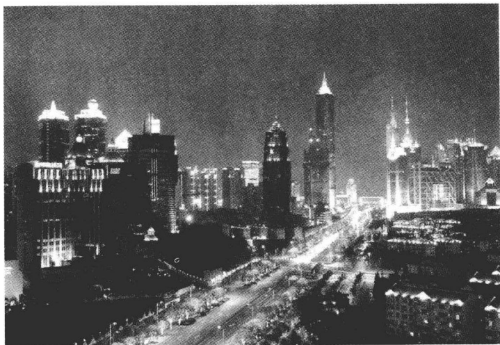
浦东世纪大道夜景。

经是上海新貌的缩影,上海的浦东已经是中国改革开放的龙头。如今的上海人都已经深深理解:只要有利于加快上海现代化速度,一切有用的人才,有能量的男女老少,无论是南方人、北方人,美国人、日本人、白人和黑人,我们都张开双臂欢迎;一切先进的科学技术和文化,不管是数字自动机床、磁浮列车,还是奇妙的数码信息技术以及西方的优秀文化,我们都敞开胸怀吸纳融会。只要是优秀的,上海信奉“拿来主义”。