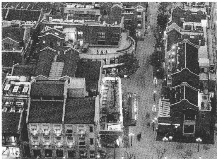
新天地夜景。上海旧街坊改造的成功范例。

上海地区首先是由于其战略地位,受到政治、军事、经济、学术、工商等各方面重要人物的关注,同时,由于 19 世纪欧美帝国主义势力的扩张,列强也对上海虎视眈眈。特别是在 19 世纪下半叶到 20 世纪上半叶这一百年左右的时期当中,上海经历了清