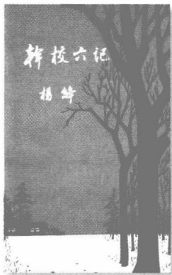
干校六记 (1981) 我们仨 (2003)

解放前钱锺书和我寓居上海。我们必读的刊物是《生活周刊》。寓所附近有一家生活书店。我们下午四点后经常去看书看报；在那儿会碰见许多熟人，和店里工作人员也熟。有一次，我把围巾落在店里了。回家不多久就接到书店的电话：“你落了一条围巾。恰好傅雷先生来，他给带走了，让我通知你一声。”傅雷带走我的围巾是招我们到他家去夜谈；嘱店员打电话是免我寻找失物。这件小事唤起了我当年的感受：生活书店是我们这类知识分子的精神家园。