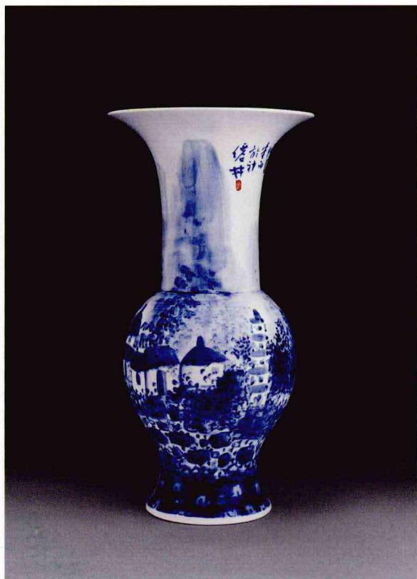
花瓶 高 44cm