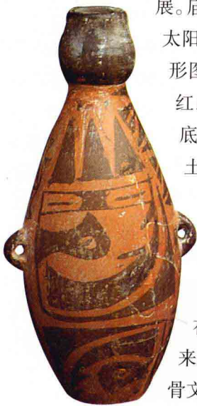
姜寨葫芦形 彩陶瓶

展。庙底沟类型的飞鸟驮日纹、跋乌(三足乌)与太阳的纹样、站立的鸟纹，以及大量简化的鸟形图案，在许多钵盆类生活用具上多有描绘。红山文化中变化丰富的鸟形玉佩等无不受庙底沟文化的影响。从历史传说和我国商代出土的器物上也有大量的鸟形装饰，反映出商代崇鸟的现象与燕山地区6000—5000年间的远古文化有着密切的关系。商氏族以玄鸟(即燕子)为图腾，《诗·商颂·玄鸟》载有：“天命玄鸟，降而生商。”帝俊在燕山山地建立了最古老的玄鸟王国，后来成为商民族的先祖。商王亥的“亥”字在甲骨文中表示为“亥”字上加鸟，这无不和商族的崇鸟习俗有关。(陆思贤)我国东部沿海地区的大汶口文化、龙山文化也是和鸟图腾有关的