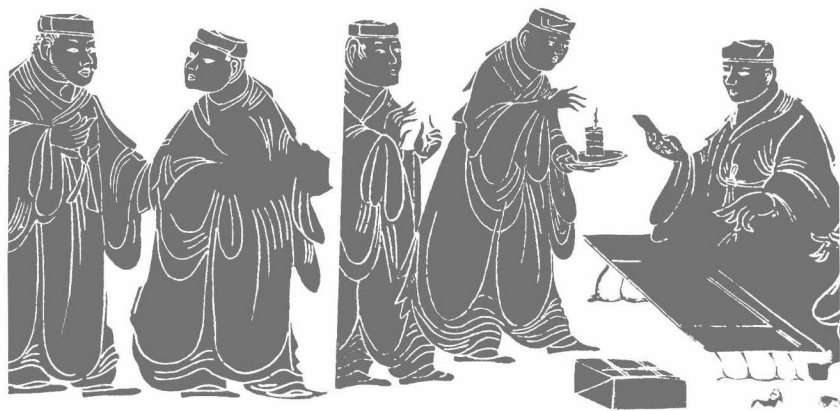
东汉文官 (河南密县打虎亭东汉墓画像石)