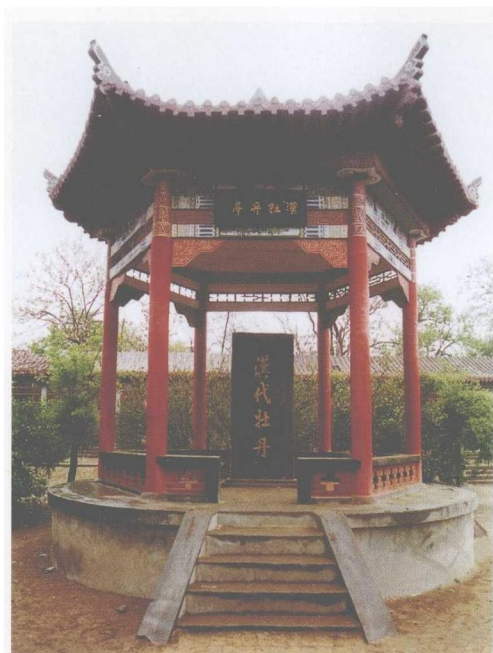
后人纪念刘秀的牡丹亭