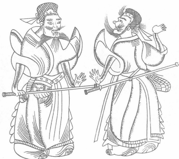
东汉武将 (山东沂南东汉墓画像石)