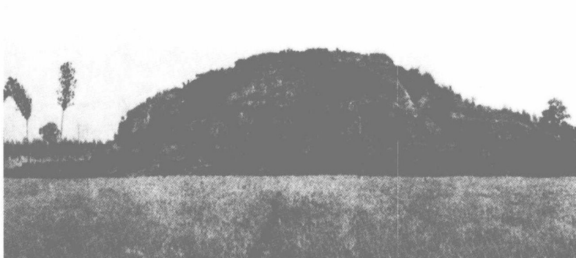
东汉灵台遗址 (光武帝晚年兴建)