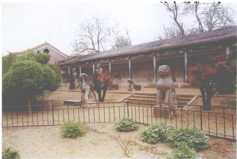
河北柏乡县原刘秀登基做皇帝发迹地千秋亭五成陌之石人石马