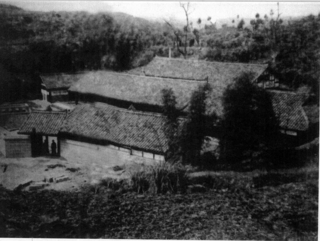
陈毅故居——四川省乐至县复兴场张安井村，陈毅在这个院落度过了自己的童年。