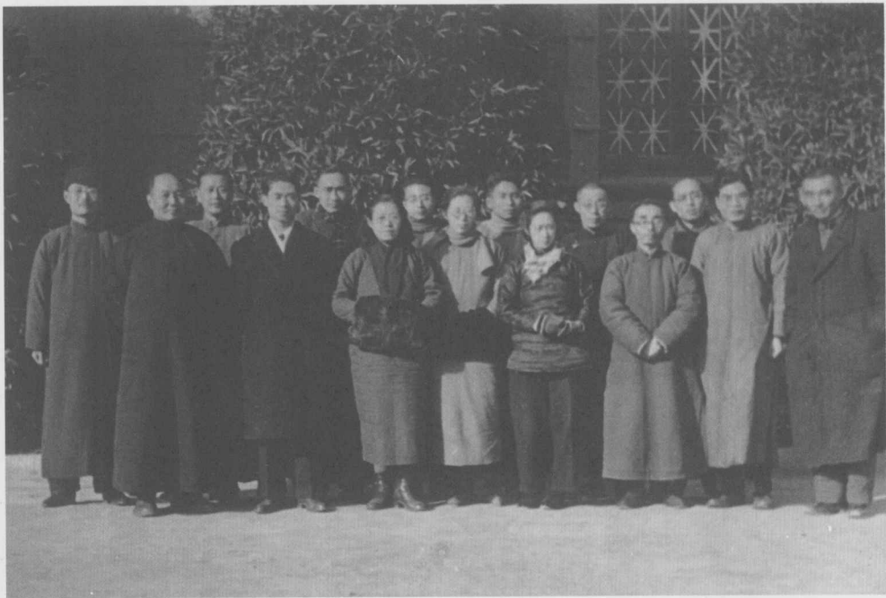
↑ 1950年，上海历史教学研究会成员合影