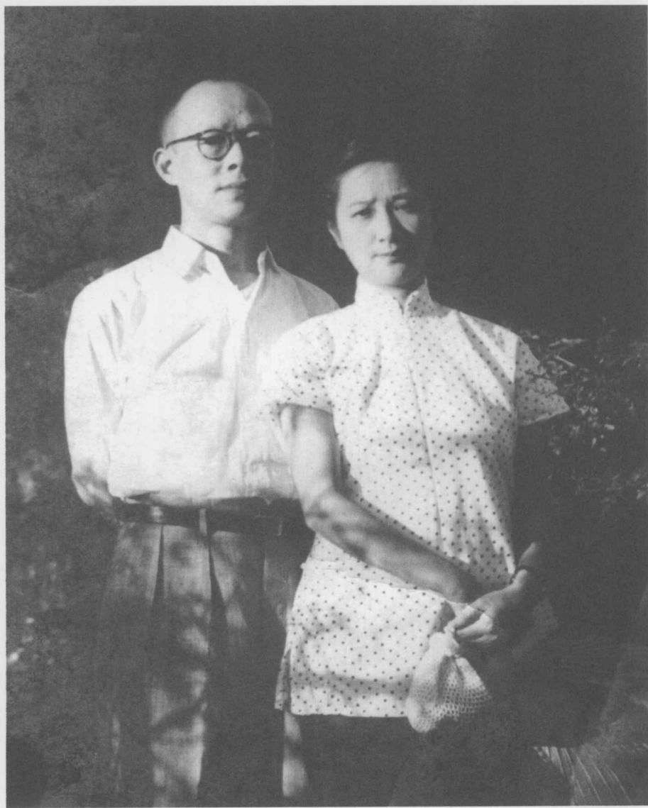
↑ 1958年，周有光、张允和夫妇合影