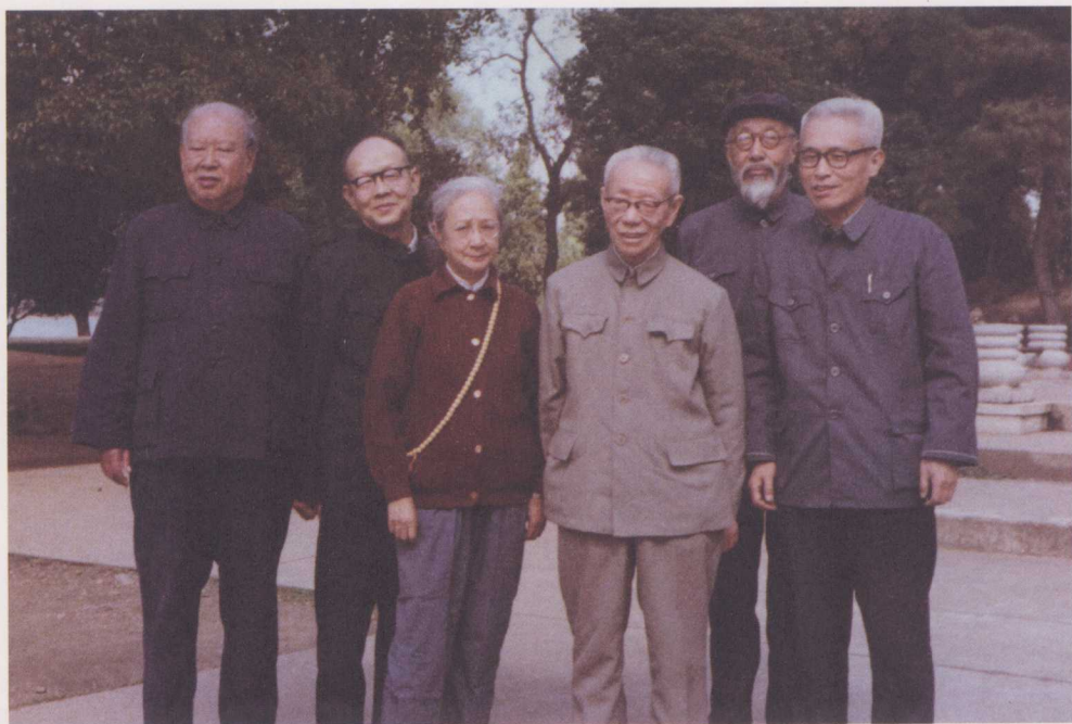
↑ 1980年，参加中国语言学会成立大会，与中国语文学界泰斗吕叔湘等人合影。（左二为周有光，左四为吕叔湘）