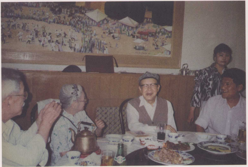
↑ 1995年6月19日，语言学界庆祝周有光九十寿辰