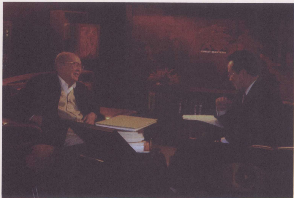
↑ 2005年12月6日，做客中央电视台《大家》栏目