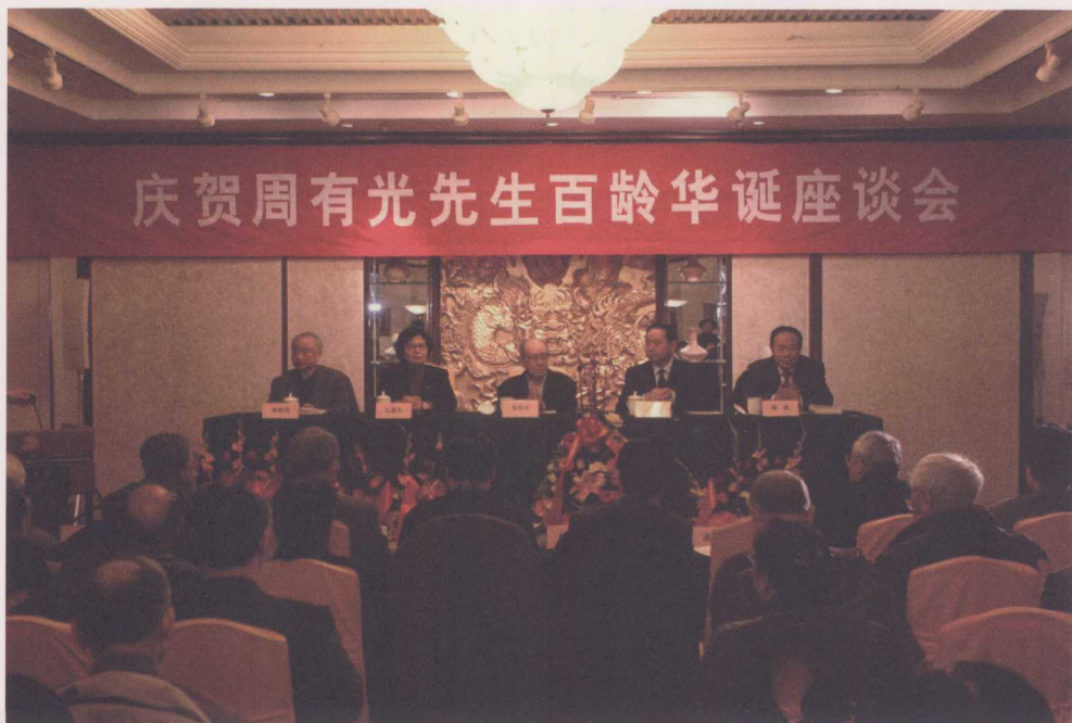
↑ 2005年1月10日，教育部、国家语委在北京召开“庆贺周有光先生百龄华诞座谈会”