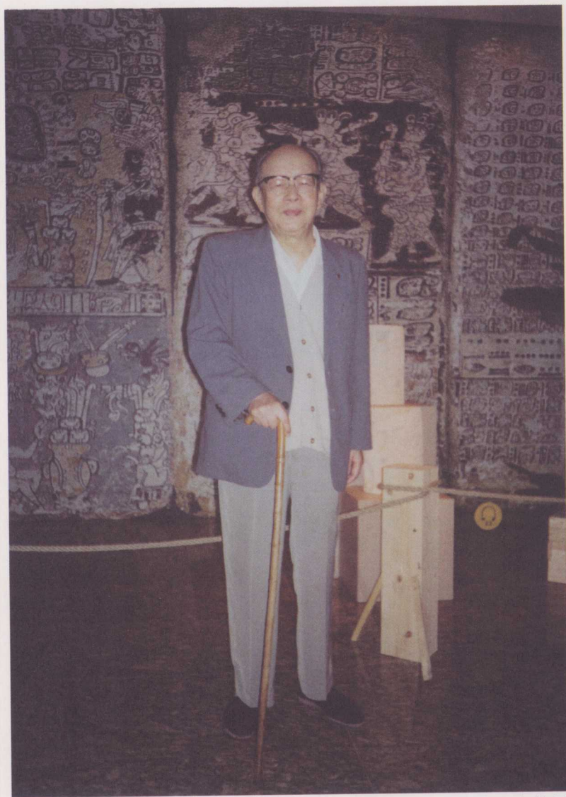
↑ 2002年，于中华世纪坛参观马亚（玛雅）文化展