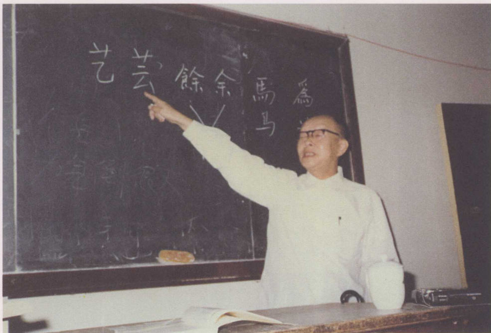
↑ 1981年8月，在日本大东文化大学讨论“文字改革与日文的关系”