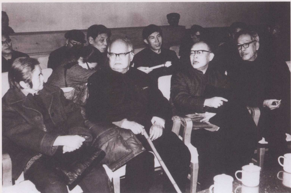
↑ 1984年，与语言学家王力教授（左二）