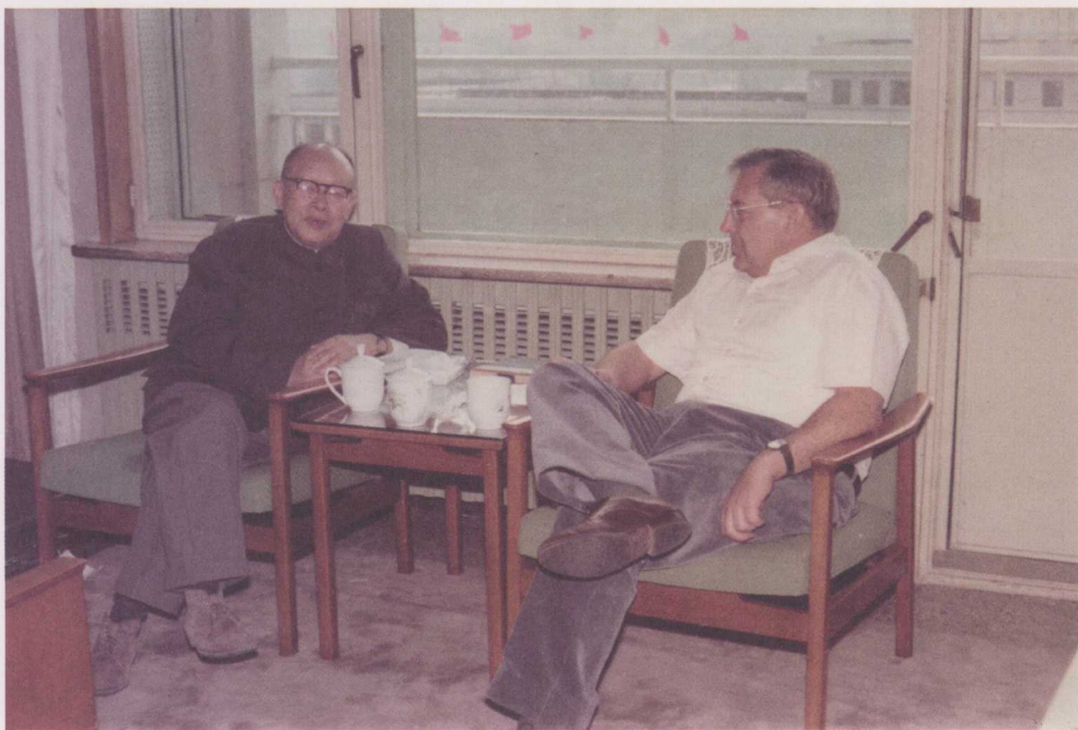
↑ 1982年，在北京饭店与欧共体驻华代表会谈