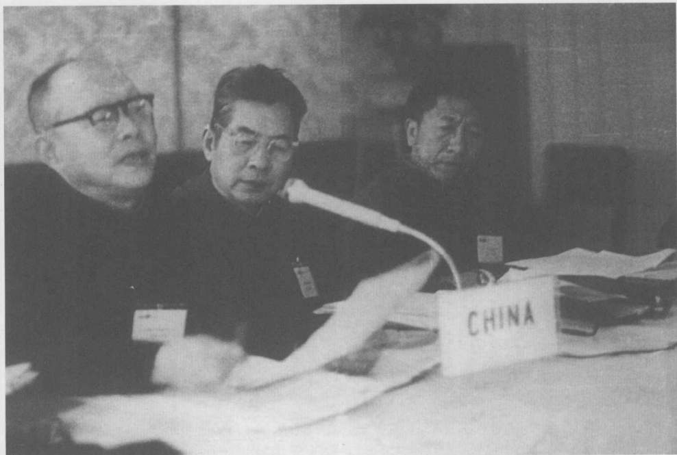
↑ 1979年4月，国际标准化组织召开华沙会议，周有光代表中国在会上发言，提议采用《汉语拼音方案》作为拼写汉语的国际标准。1982年，《汉语拼音方案》正式成为拼写汉语的国际标准，并被联合国采用，在全世界推广。（左一为周有光）