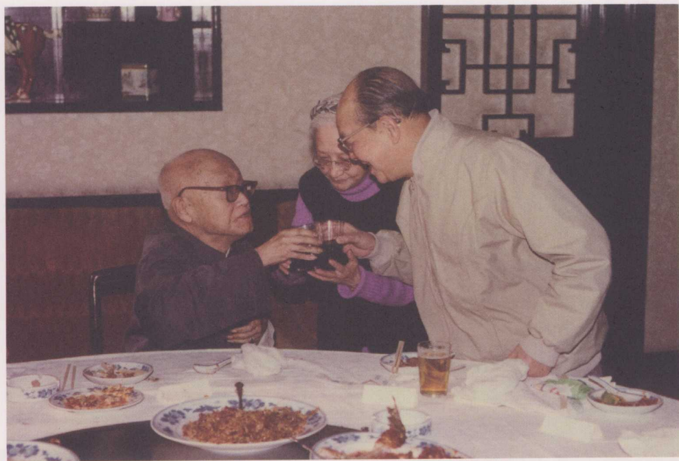
↑ 1989年，周有光夫妇为俞平伯90岁生日祝寿