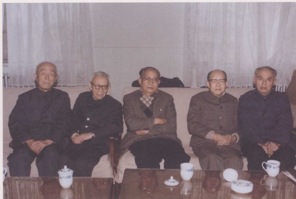
↑ 1986年，语言学界学者聚会（左起：季羨林、吕叔湘、许国璋、周有光、马学良）