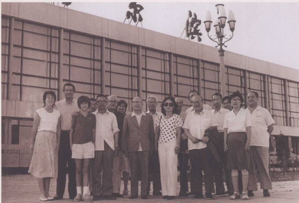
↑ 1982年7月，《简明不列颠百科全书》中美联合编审委员会成员合影