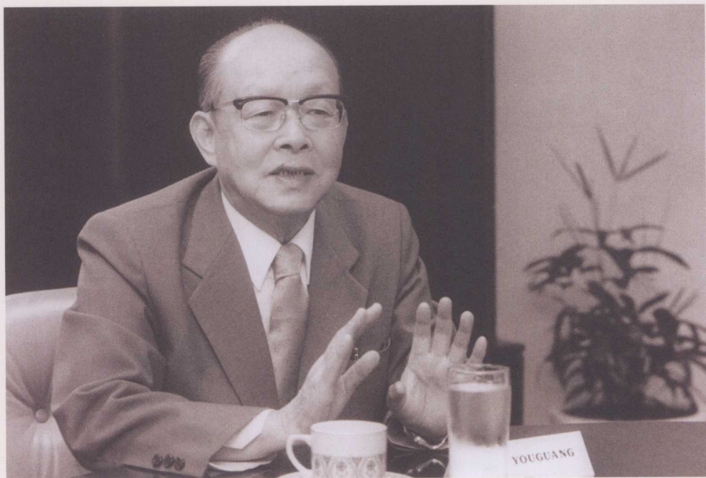
↑ 1987年12月1日，在新加坡联合早报进行学术演讲