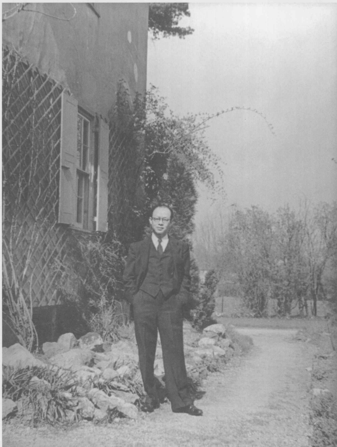
↑ 1948年，周有光在英国剑桥大学