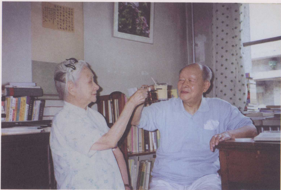
↑ 1999年6月，夫妻举“杯”齐眉