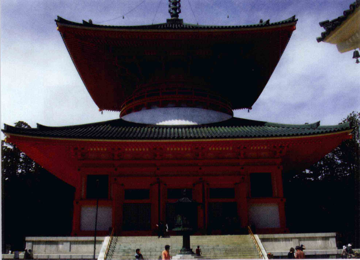
高野山根本大塔及石灯