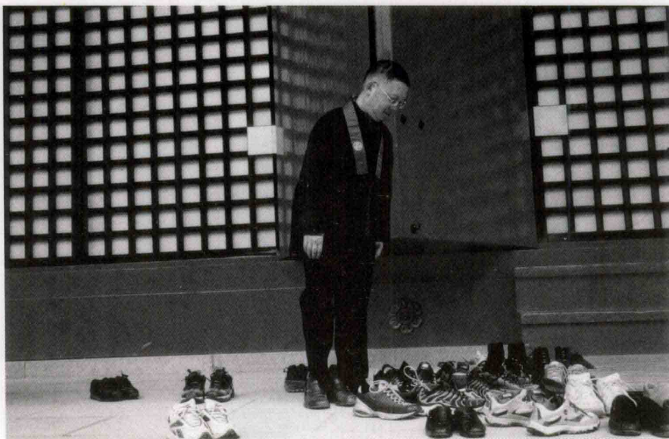
入寺庙前必须脱下烦恼鞋

未见菩萨，先来三个大道理。不说一句话，让人人用行动来领悟，一说即通，一说即悟，自己身体力行，人人受教，此教育深入骨髓，震荡得很久很久。