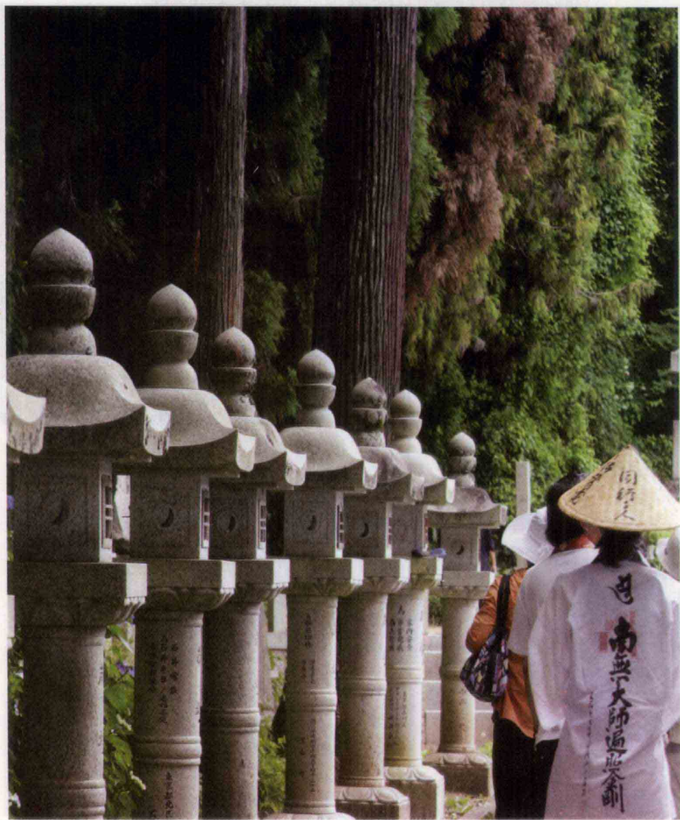
参道，石灯，修行者——自灯明，法灯明