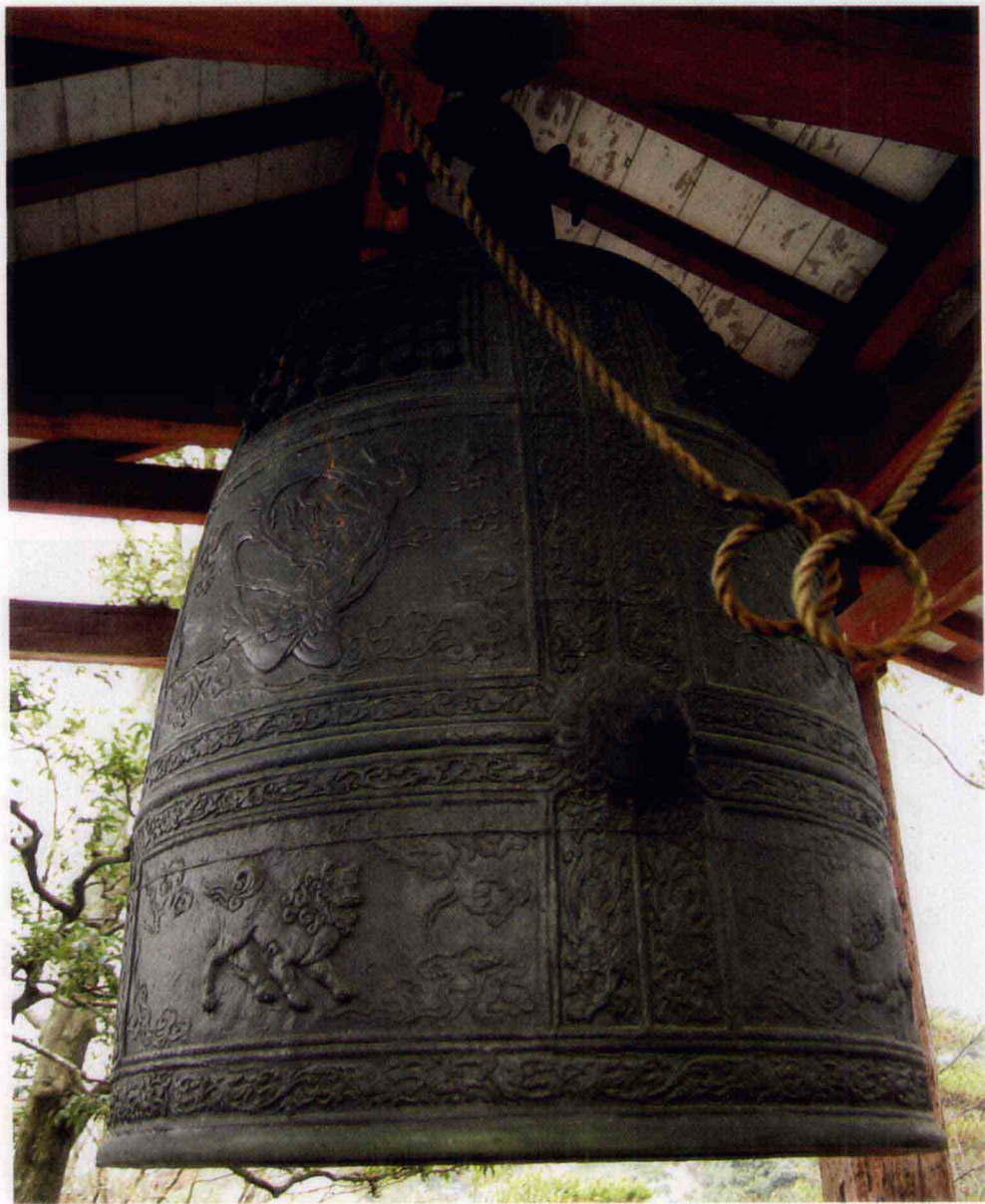
凤凰堂古钟上的雕刻也是礼佛的艺术