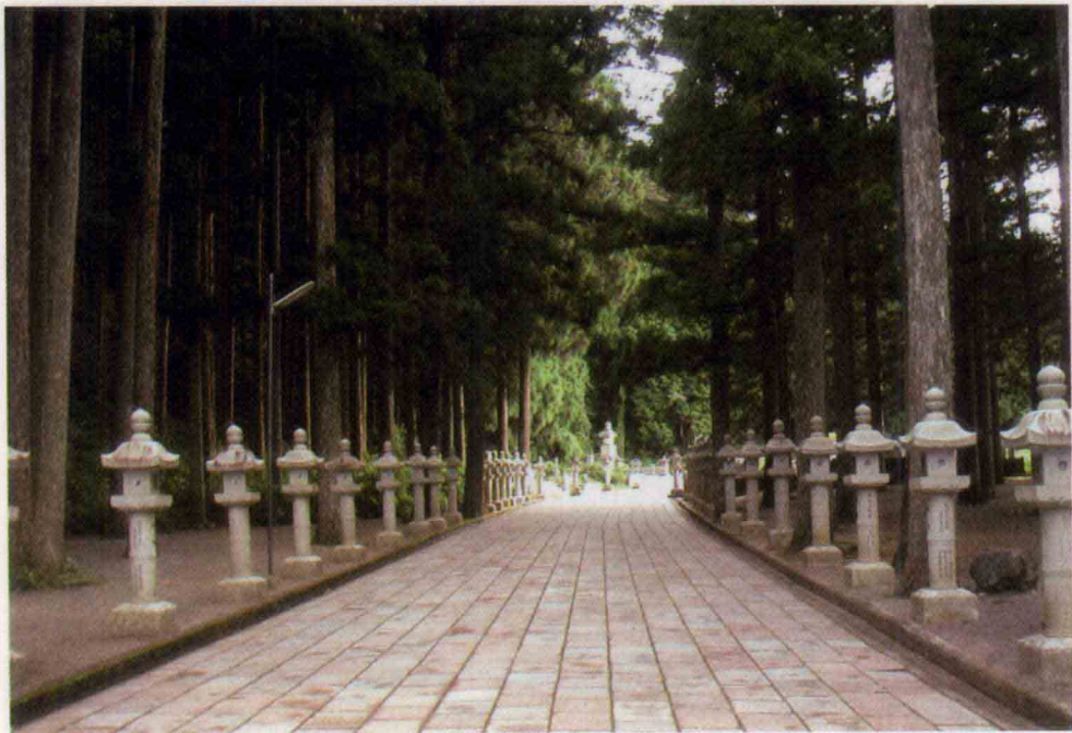
高野山参道两旁的石灯

原来，这一对石灯放置在此，也足有四十年的时间，是应日本寺院所订而特别雕刻的。不知什么原因，石灯没有远到日本去，一直在这园里放置了这么长时间。香港一般的园林装饰者都不懂得欣赏这石灯，也没有客人要买，且由于雕工及石质特别，园