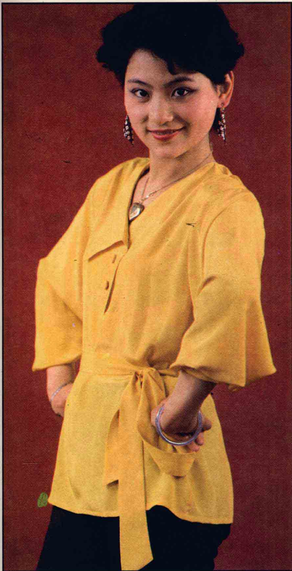
● 不对称领束腰衬衫