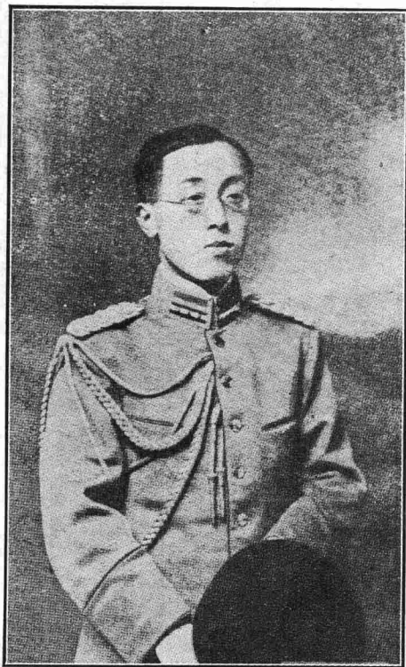
赴 禁 國 全 煙 民 華 中 英 聯 大 陸 總 大 軍 章 代 合 總 中 適 表 總 統 中 駿 會 軍 將 正 事 將 會 顧 長 長 問