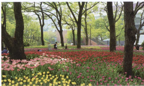
早晨的花园，漂亮的色彩

美丽旅游摄影不仅可以旅游，在很多情况下还可以拍摄到好的作品。与画家不同，作为摄影师，尤其是风景摄影师来讲，要掌握实际情况，而等待恰当的时机是唯一的选择。在当今以效率为目标的社会中，等待要花费很长时间，等待受到怀疑，其原因是这种等待是无法预知结果的。很多时候，摄影师支好三脚架，装好相机，站在那里无所适从，这就是等待，等待时机的来临。