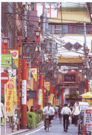
日本街头，边走边拍，不要理会太多，追求生活的自然

旅游摄影爱好者的任务就是记录视觉影像，展示他的才能，表达重要的观点。同画家一样，他的任务永远不是报道客观事物，而是舍去不需要的内容，表现他所喜欢的内容。