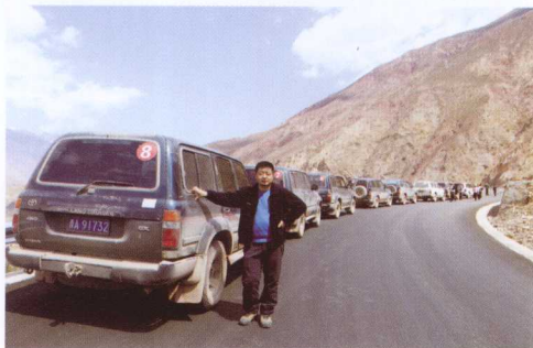
享受自驾游的乐趣

选择正确的光线，选择理想的时间，选择最佳的拍摄位置和所希望的图像的分析，观察、等待，然后按下快门才能拍摄出好的照片。当然，这里的技术成分很多。虽然相机是不会说话的，但却是在你手里的，因而照片是你看到的，感受到的，完全是个人观察方式的体现。照片越个性化，照片的表达就越清楚。旅途中拍摄并不是过按快门的瘾，咔咔咔，清脆的快门声让我们得到某种记录的满足，仿佛美景为我拥有。然而摄影要有选择，只有几毫米的截面变化就会使照片表达出完全不同的效果，真实就存在于这些不同的效果之中。