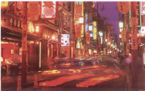
刚刚入夜的街头，华灯初上。用慢快门把行驶的汽车刷在画面上

到了黄昏，雨过天晴，阴影渐长，夕阳斜下，美不胜收。落日还未尽去，夜色慢慢袭来，万家灯火出现在摄影者相机的镜头里。摄影者需要等待，但每时每刻都会有精彩的事情发生，都有绚丽的画面出现。所以，在等待的时候也要观察周围的环境，说不定，就会有意外的收获。