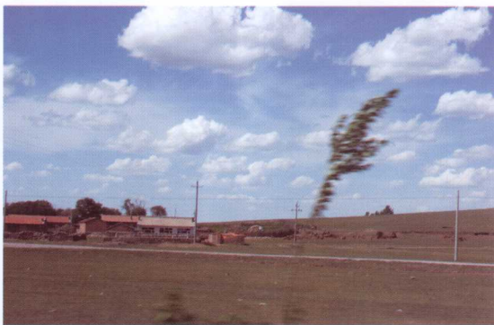
午后刮来的狂风，使您有了一次惊险的体验

午后的海边，突然下起一阵骤雨，天空云雾四起，海天变幻无穷，光影扑朔迷离。然而唯有在这样的奇景中，才能有幸邂逅到如此难忘的景色。而不少优秀的摄影作品，就是在这样的天气下拍摄的。