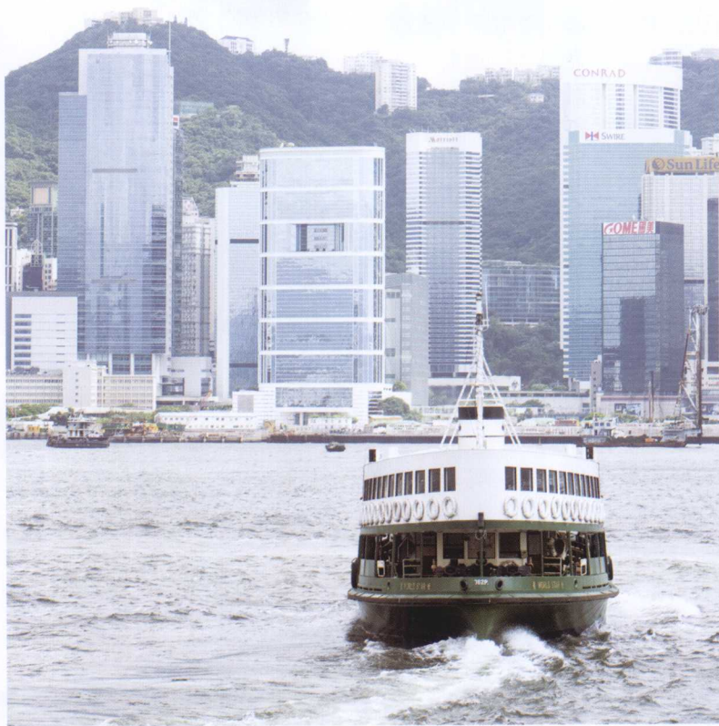
轮渡开了，要起程了

有的时候，摄影者在等待游人散去，获得安静的场地或最佳的拍摄位置。更多时候，是在等待光线。摄影是捕捉光线的艺术，是用光来表现画面的亮点。