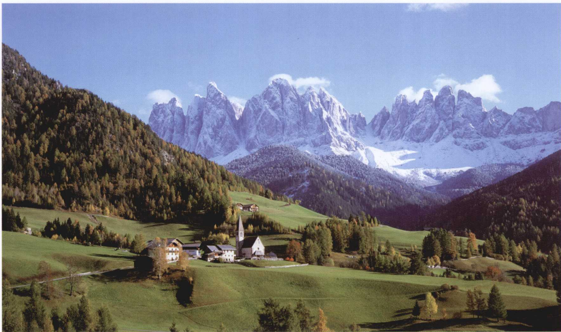
抢占有利的位置，获得良好的拍摄角度才能拍摄到美好的风景照片