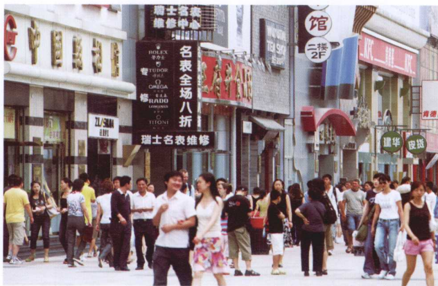
北京王府井步行街