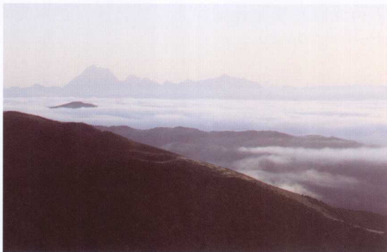
温柔的阳光已经照射出来

一大早醒来，日出前柔和的曙光映射在窗帘上，东方的天空染着一抹红霞，旭日慢慢地东升，万丈光芒从山的一边投射出来，野花娇艳欲滴，草地上凝结了无数亮晶晶的露珠，多么美丽的清晨。