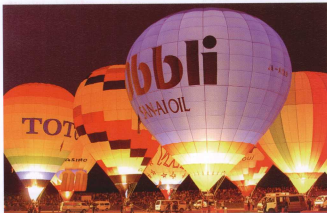
五彩斑斓的热气球升空

在于唤起人们的记忆，唤起旅行者的记忆，展示个人经历，满足人们永远填不满的好奇心。对于每个旅途摄影者来说，行走在路上的经历往往比