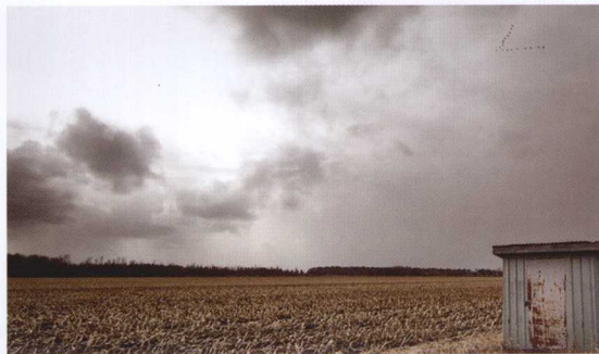
拍摄时，一定要把天空压低，超过画面的2/3，表现山雨欲来的浓重景象