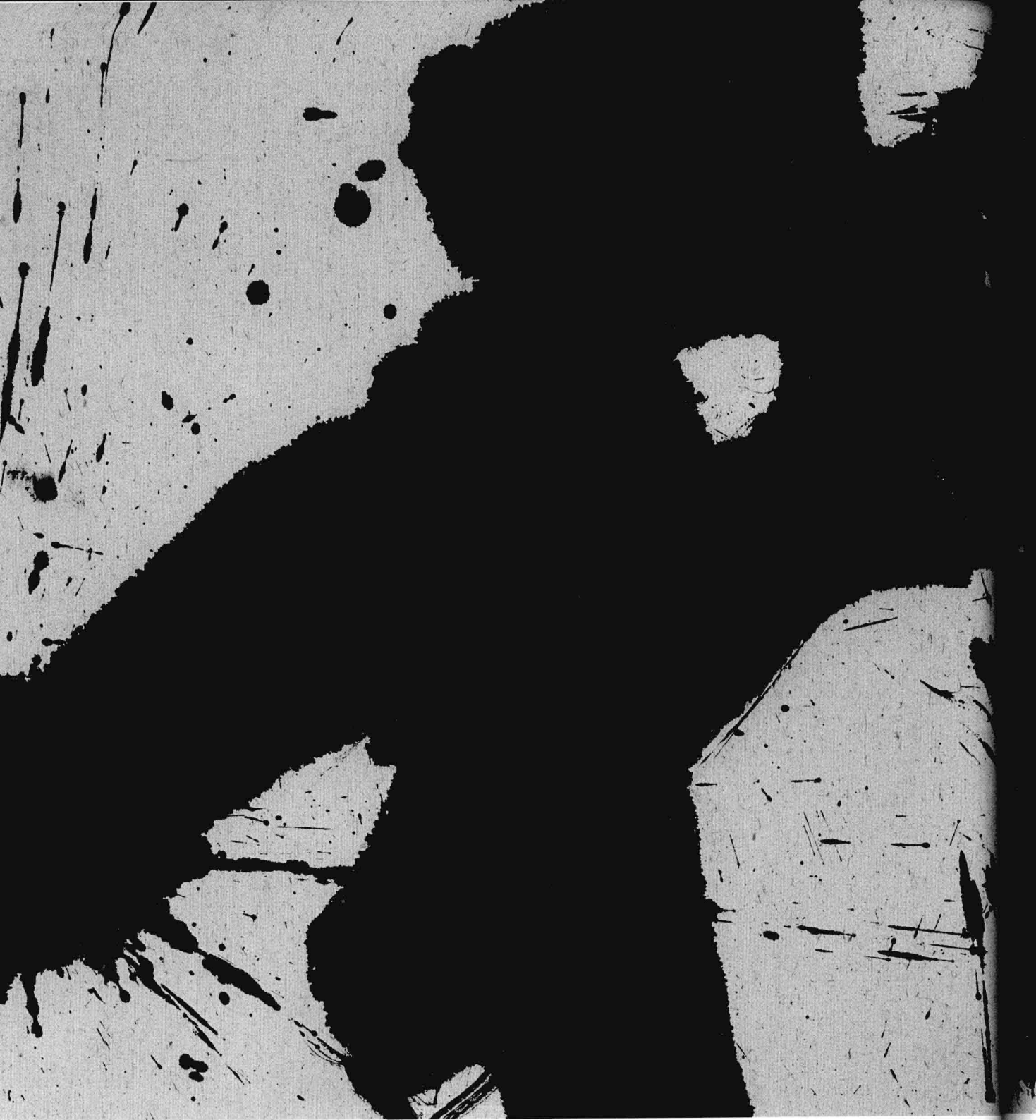
畅神 69 × 138cm 2003年