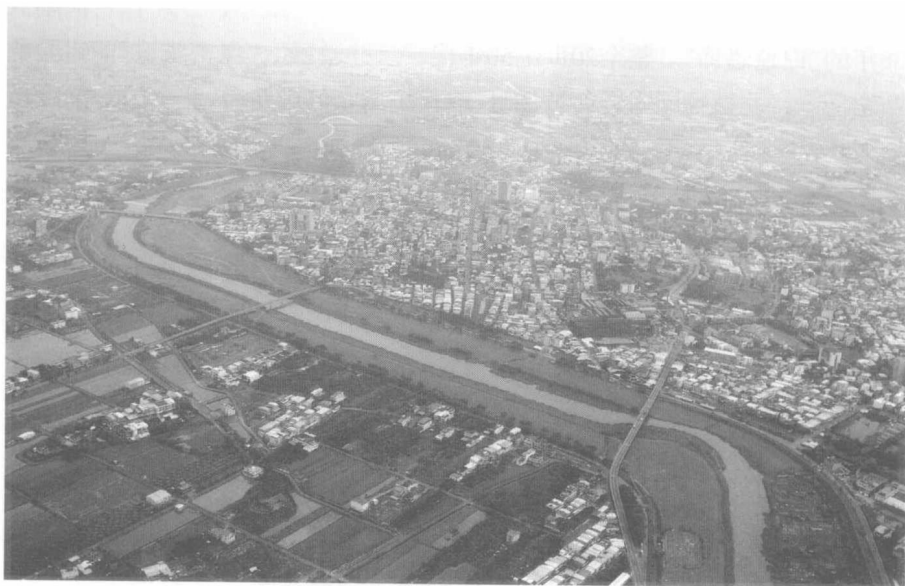
图为宜兰航拍全景图。

林毅夫的家乡宜兰位于台湾东部。与台湾西部相比,台湾东部的经济一直比较落后。而宜兰位于台湾发展最边缘位置的东半部,在台湾工业化的不