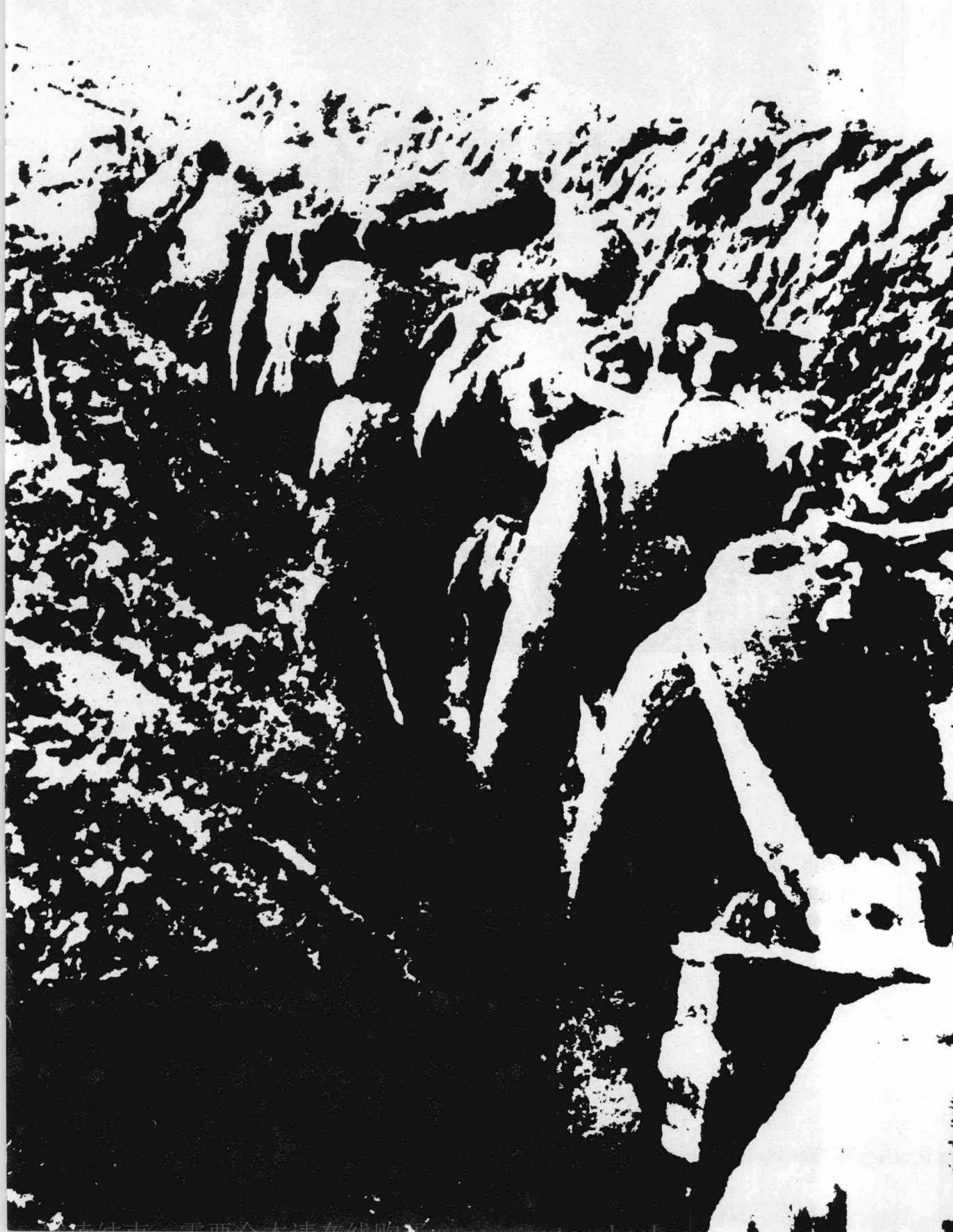
1954年10月，在越南河内市郊区的稻田里，孩子们正在玩耍。