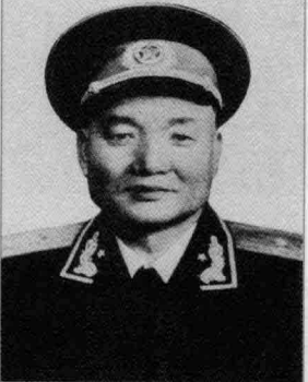
二野第 19 军 军长