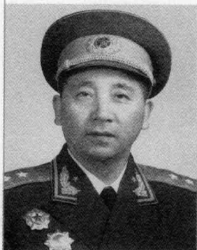
二野第 15 军 军长