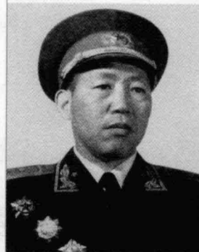
二野第 17 军 军长