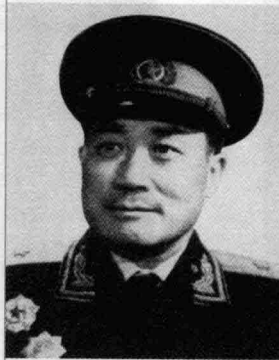
二野第 18 军 军长