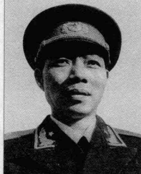
二野第 16 军 政委