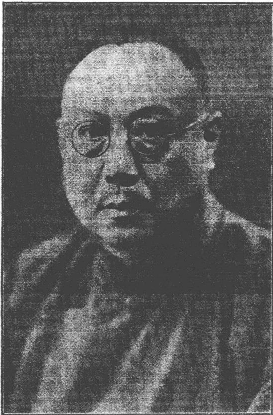
生先融 任主董事陳