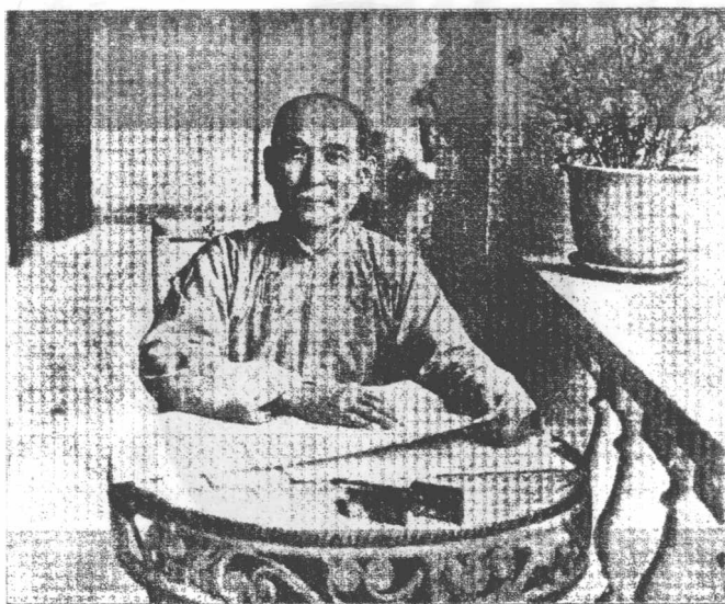
總 理 遺 像