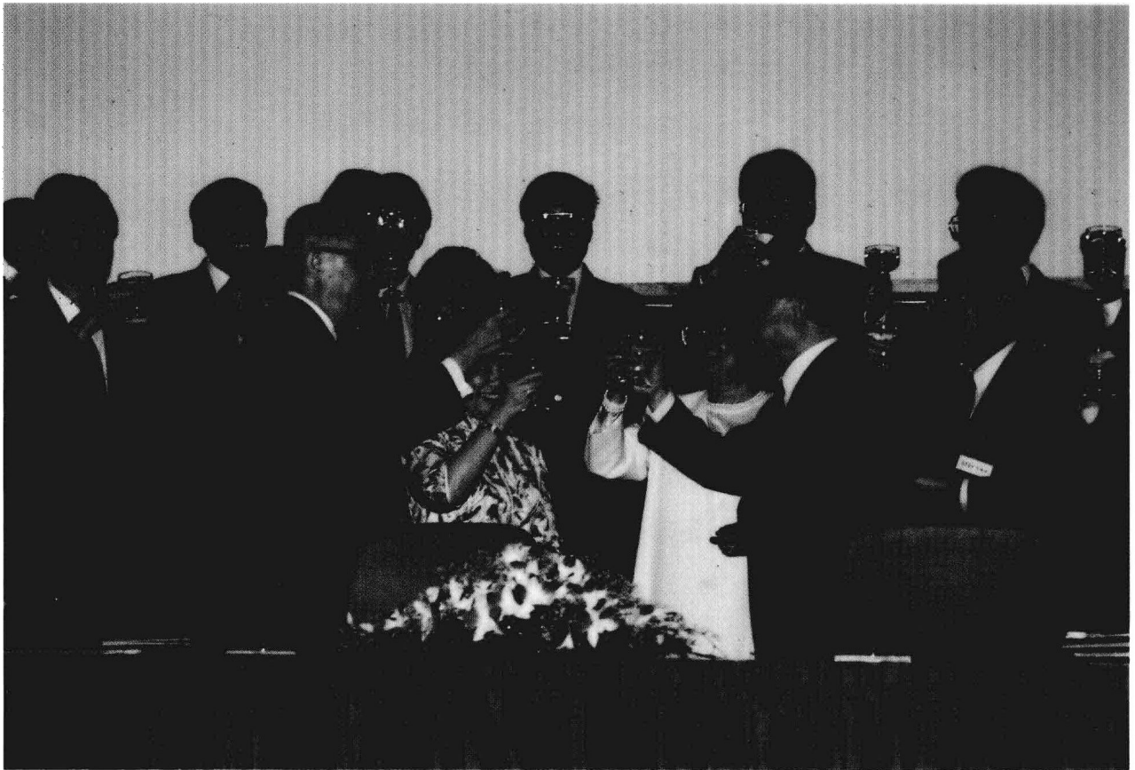
辜董事長與海協會汪道涵會長於協議簽字後舉杯互敬。