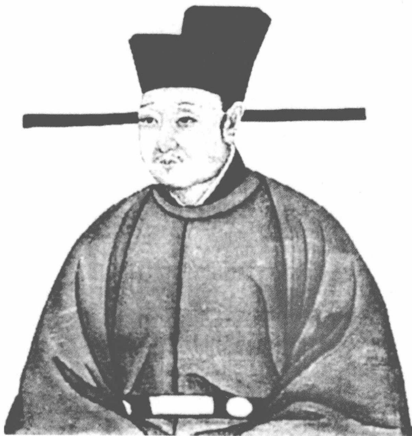
宋徽宗(1082—1135),即赵佶。神宗之子,哲宗之弟。1100—1125年在位。有书法、绘画等天才,却乏治国平天下之才能。其退位之时即是陆游出生之日。

敌人是不会睡觉的。北宋初年，东北方面的敌人是契丹部族的辽国。宋、辽之间曾经有过几次战争。经过景德元年(1004)澶渊之战以后，宋的统治者以每年向辽国奉上银十万两、绢二十万匹的代价，买取了北方的安定。腐朽的空气同时弥漫在宋、辽的两方。12世纪的初年，北方的女真部族又起来