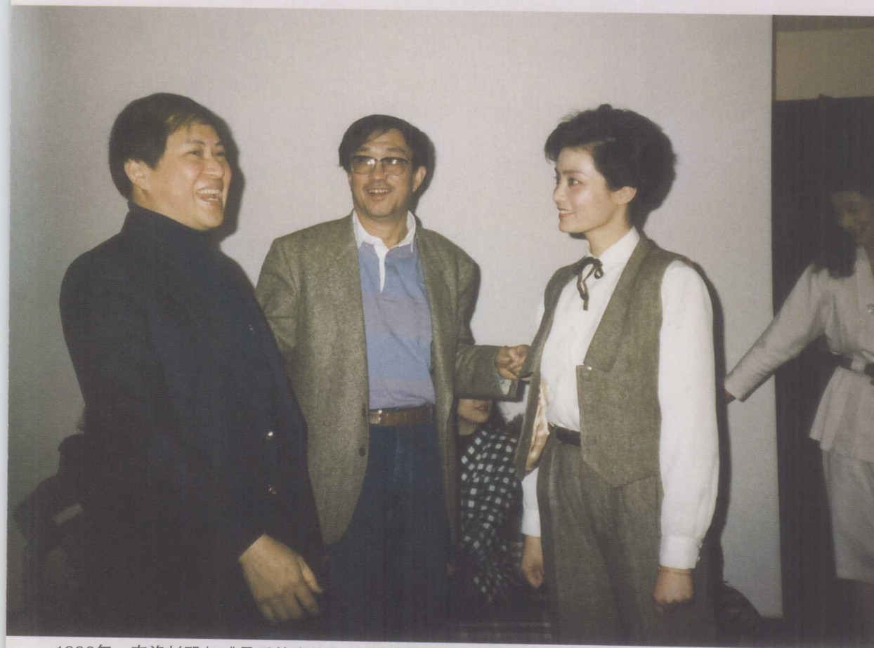
1998年，在洛杉矶与《最后的贵族》导演谢晋、女主角潘虹