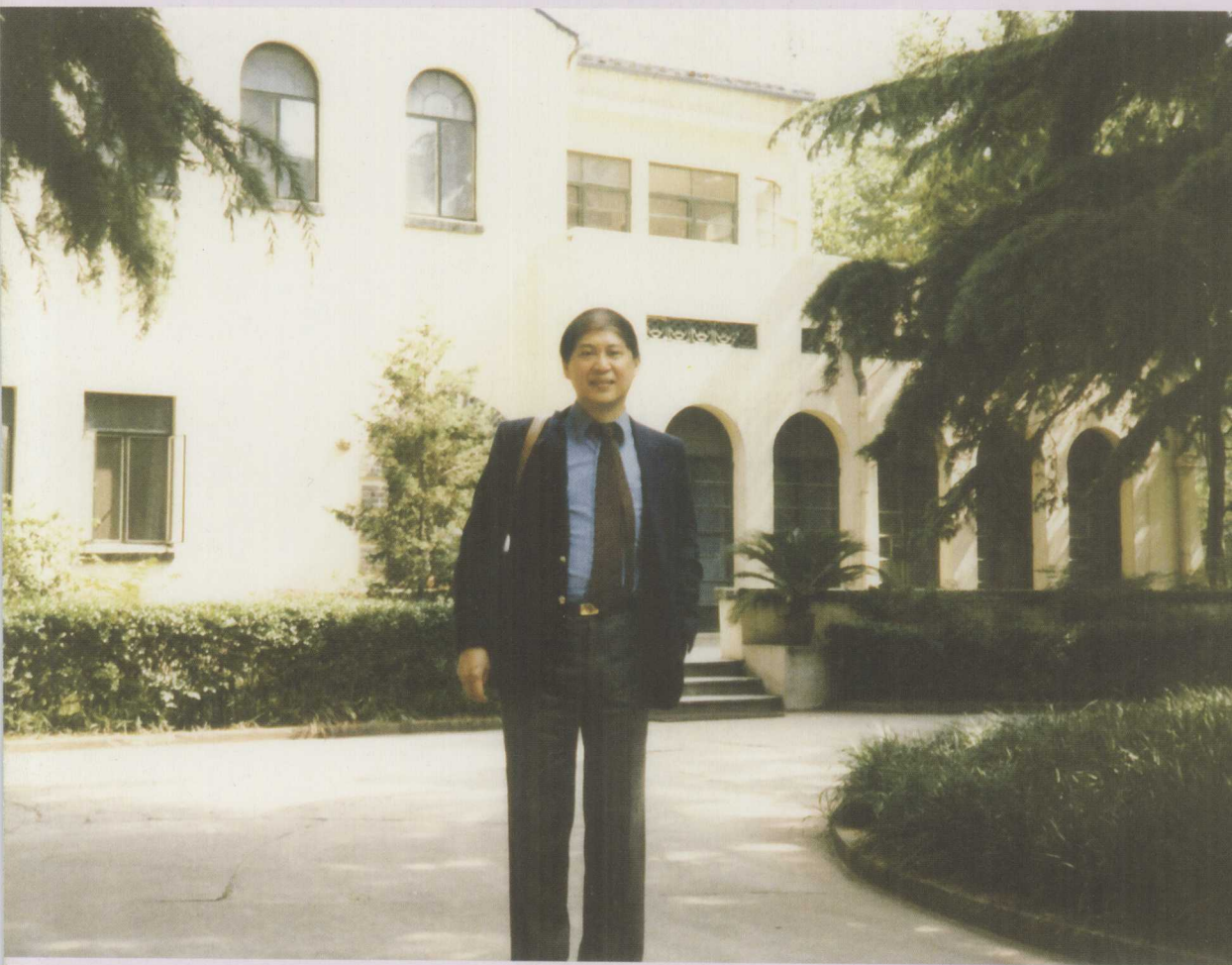
1987年，首次回南京在南京大学演讲