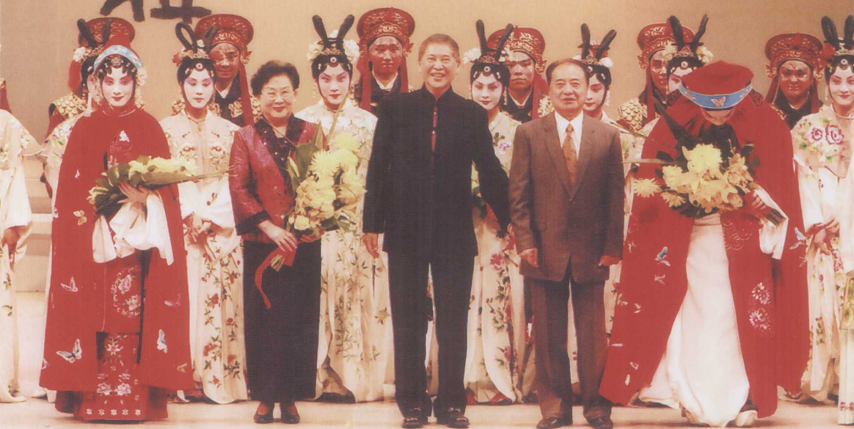
2006年，青春版《牡丹亭》在加州大学尔湾校区上演谢幕