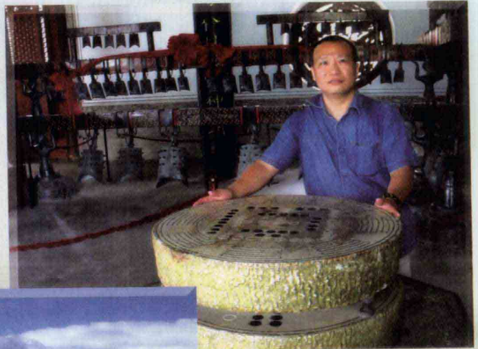
甘肃天水伏羲庙内刻有先天八卦、河图和洛书的石盘