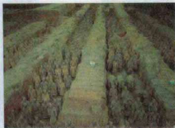
西安秦始皇兵马俑