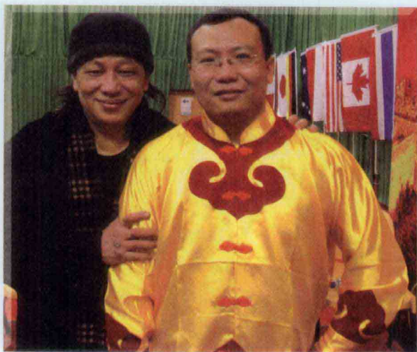
作者与香港著名影视功夫巨星梁小龙