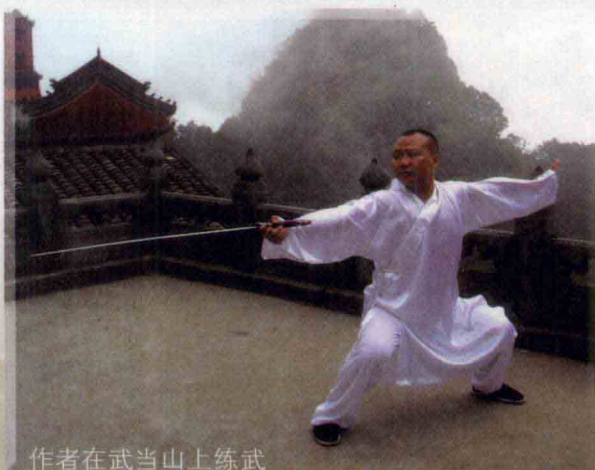
作者在武当山上练武