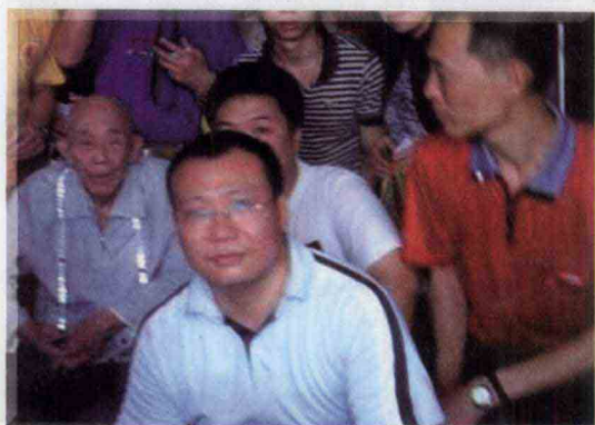
作者等与佛学泰斗、中国佛教文化研究所原所长吴立民