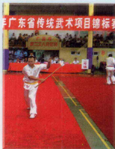
作者参加广东省传统武术项目锦标赛获得一等奖