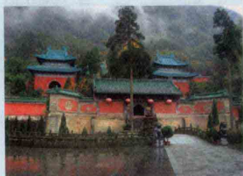
第一仙山湖北武当山