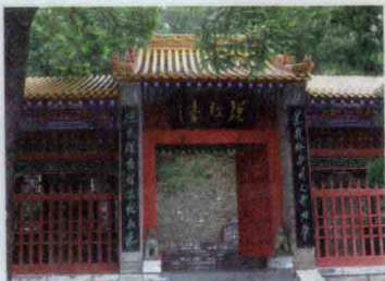
陕西终南山说经台