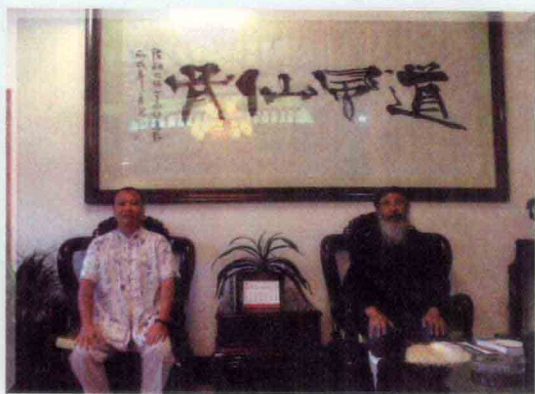
作者与中国道教协会会长任法融