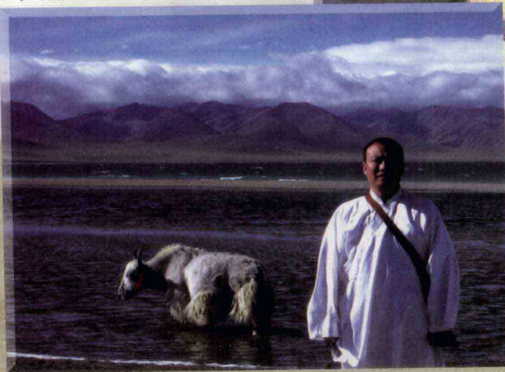
西藏纳木措，人、牛羊、湖、雪山、蓝天、白云连成一片