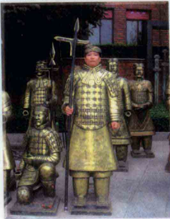
参观秦始皇兵马俑后留影