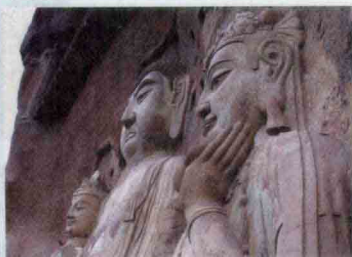
甘肃天水麦积山石窟