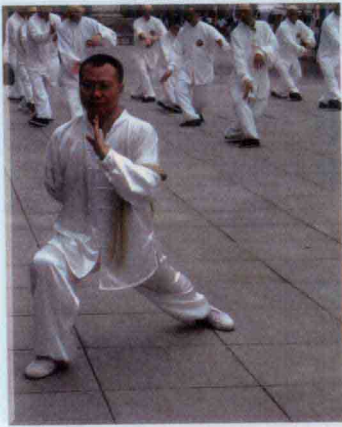
迎北京奥运火炬接力活动武术表演