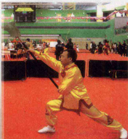
作者参加香港国际武术比赛获得名次