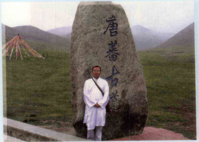
甘肃唐蕃古道是古代内地与边疆的纽带