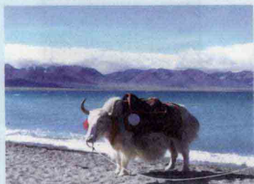
西藏三大圣湖之一纳木措