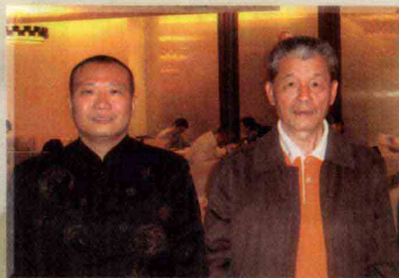
作者与中国书法美术家协会副主席陈之泉