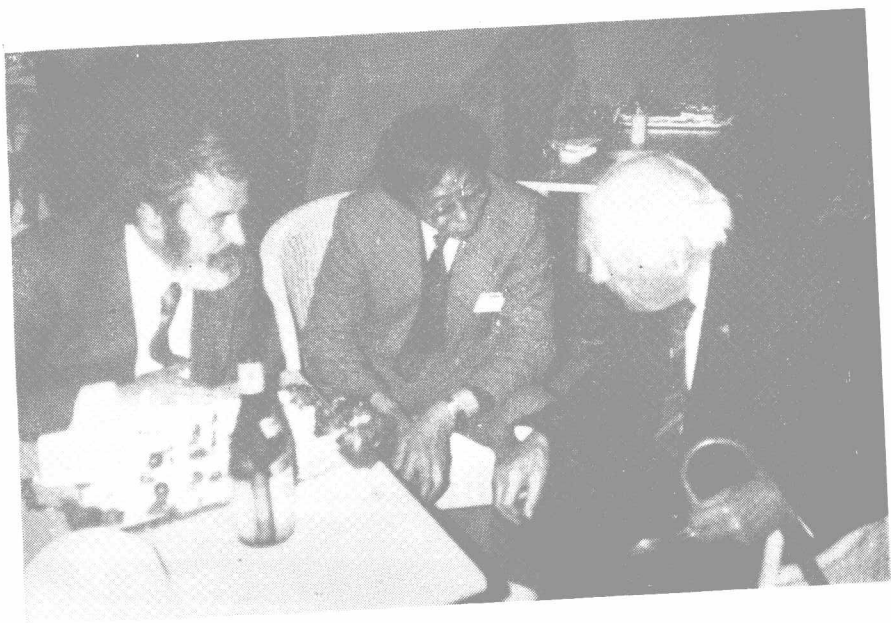
加达默尔与译者讨论《真理与方法》一书中的问题