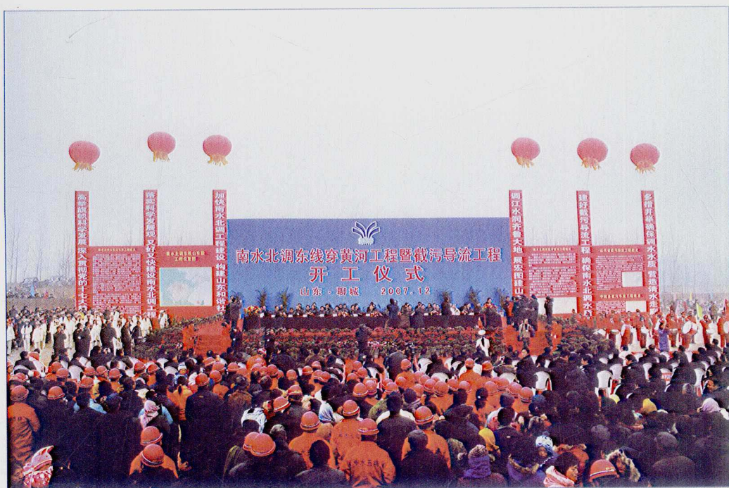
■ 2007年12月，南水北调东线一期穿黄河工程暨南水北调东线山东段截污导流工程宁阳县洸河截污导流工程开工建设。