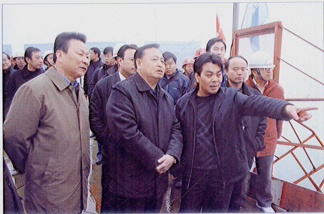
■ 2007年12月，湖北省省委书记罗清泉考察南水北调中线一期水源工程——丹江口大坝加高工程。