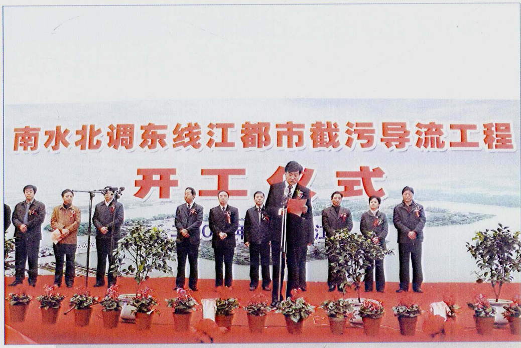
■ 2007年12月，南水北调东线一期工程江都市截污导流工程开工建设。