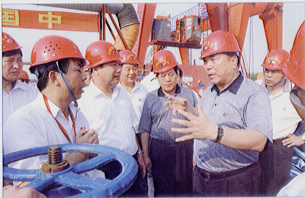
■ 2007年7月，河南省省长李成玉考察南水北调中线一期穿黄工程。