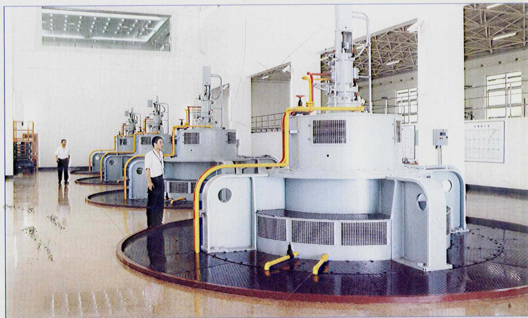
■ 2007年7月，南水北调东线一期工程宝应泵站管理项目部工作人员正在对机组运行情况进行巡查。