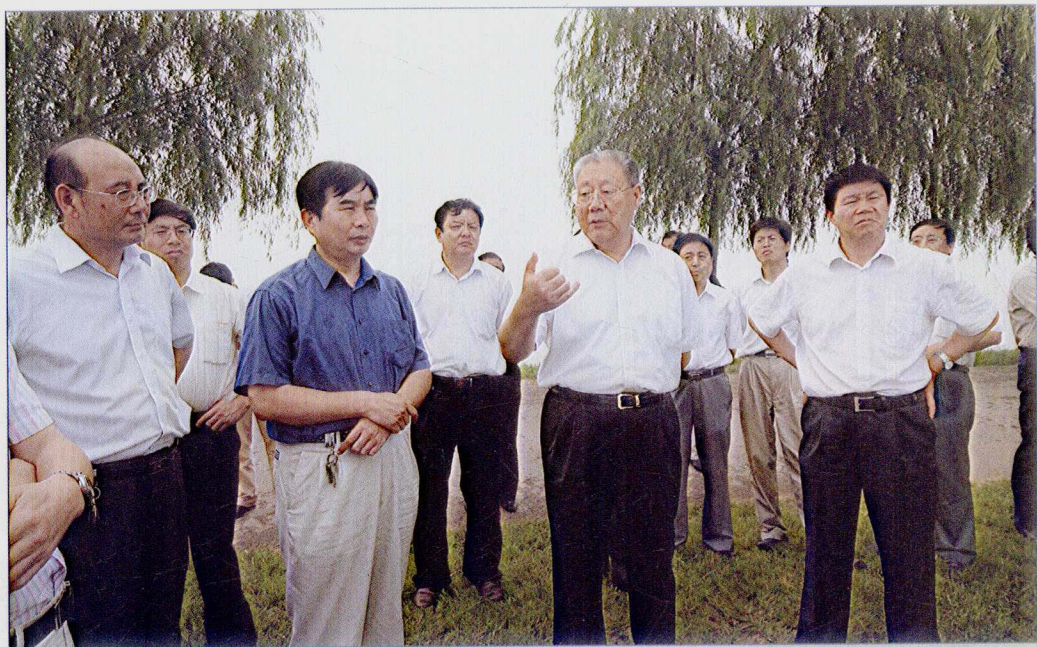
■ 2007年7月，国务院南水北调办主任张基尧调研南水北调东线一期工程南四湖—东平湖段工程建设有关情况。