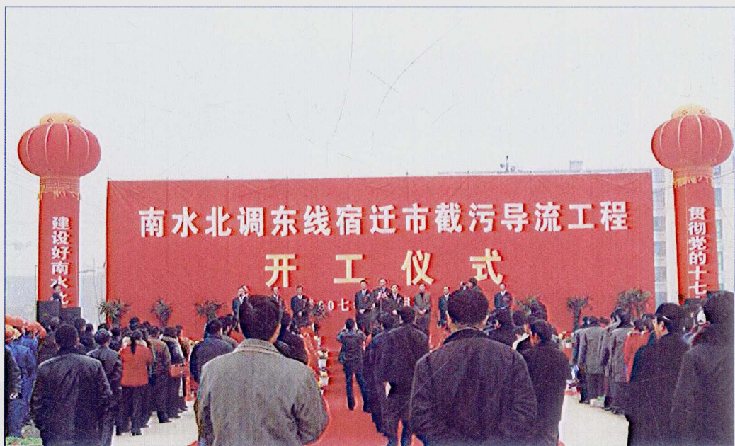
■ 2007年12月，南水北调东线一期工程宿迁市截污导流工程开工建设。