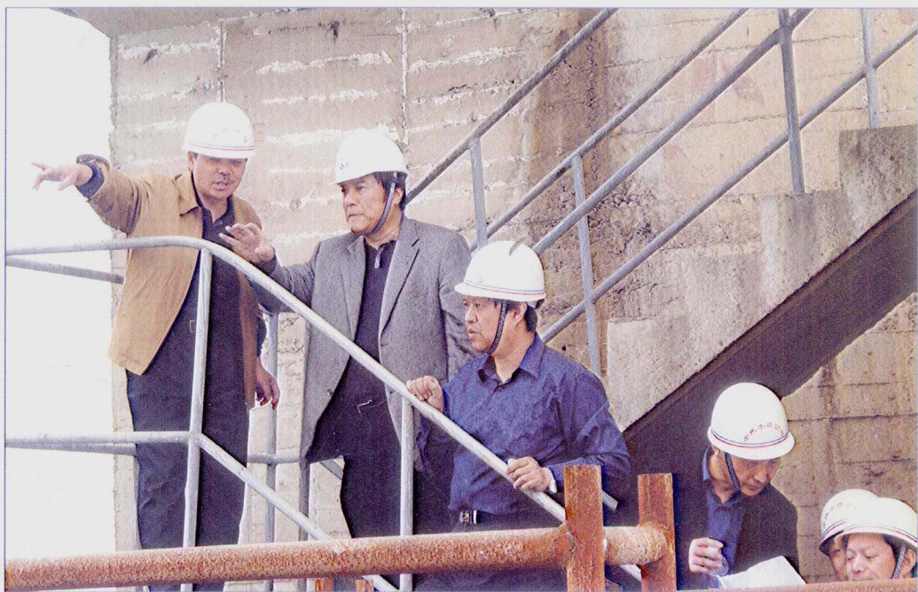
■ 2007年3月，水利部副部长矫勇考察南水北调中线一期水源工程——丹江口大坝加高工程。