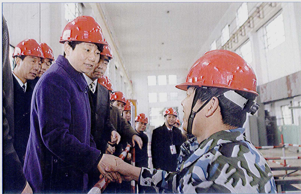
■ 2007年2月，江苏省副省长黄莉新慰问春节期间坚守在南水北调东线一期江都泵站改造工程上的建设者。