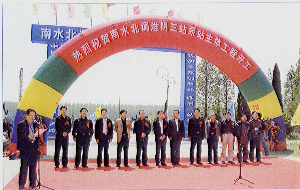
■ 2007年4月，南水北调东线一期工程淮阴三站泵站主体工程开工建设。