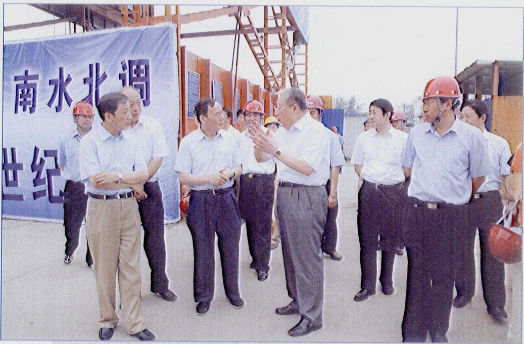
■ 2007年8月，北京市市长王岐山、副市长牛有成陪同国务院南水北调办主任张基尧考察南水北调中线一期北京段工程建设情况。