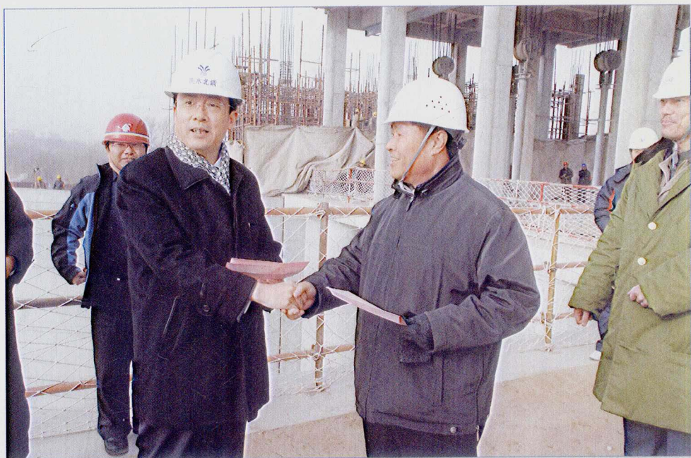
■ 2007年12月，国务院南水北调办副主任张野考察南水北调中线一期京石段应急供水工程。