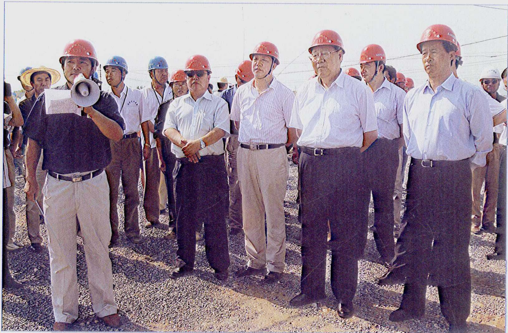
■ 2007年8月，河北省副省长宋恩华陪同国务院南水北调办主任张基尧考察南水北调中线一期京石段应急供水工程河北段瀑河倒虹吸工程施工现场。