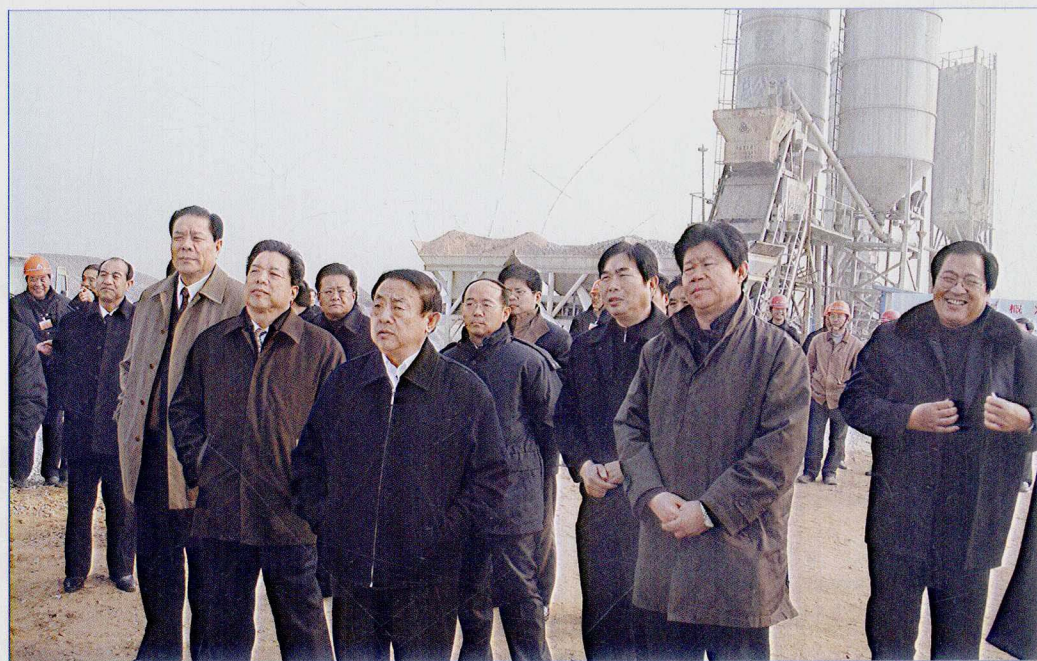
■ 2007年1月，山东省省长韩寓群、副省长贾万志考察南水北调东线一期万年闸泵站工程。