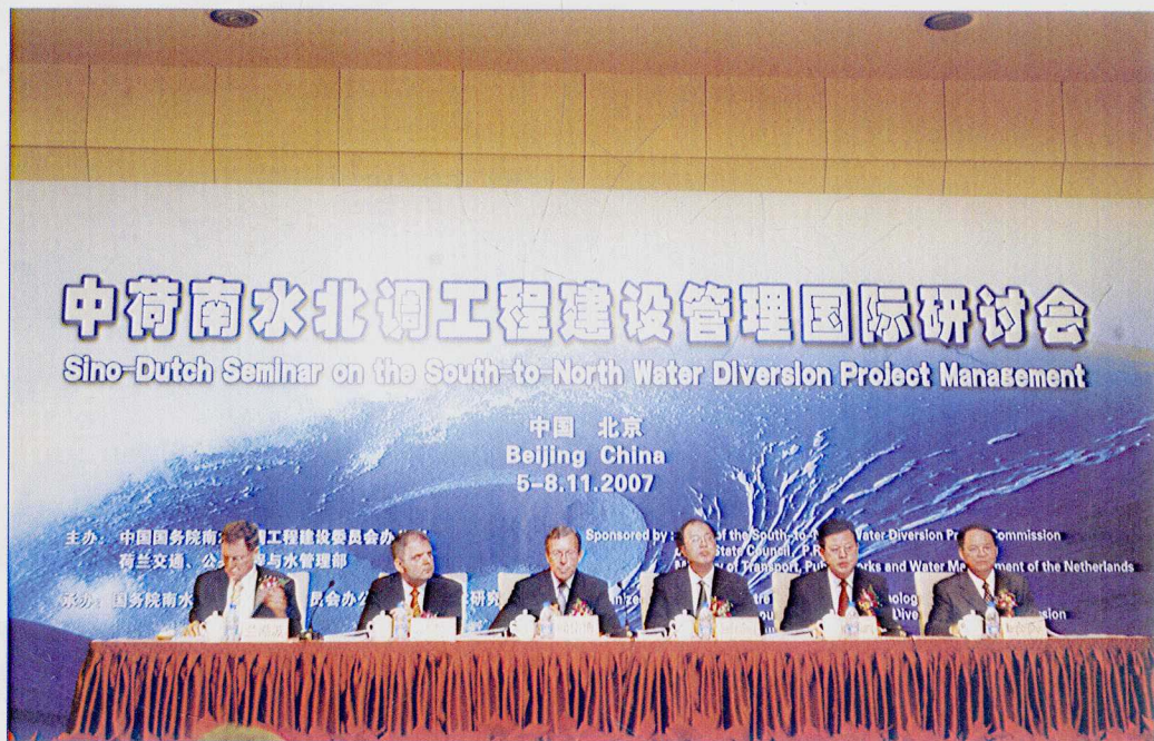
■ 2007年11月，中荷南水北调工程建设管理国际研讨会在北京召开。