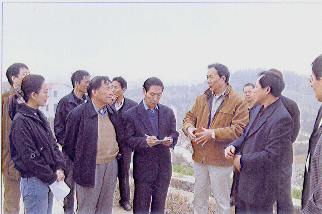
■ 2007年11月，国务院南水北调工程建设委员会专家委员会组织专家现场考察南水北调中线工程——丹江口坝区三宫殿办事处水源新村农村居民集中安置点。