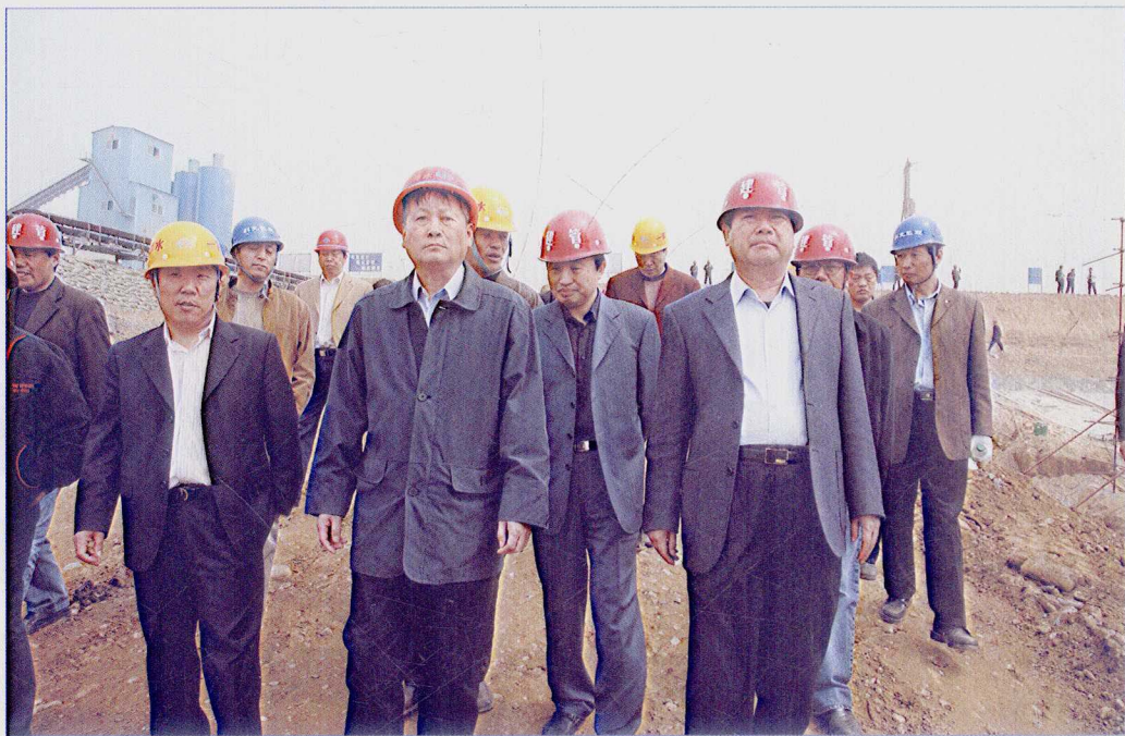
■ 2007年4月，国务院南水北调办副主任宁远考察南水北调中线一期工程总干渠河南安阳段工程。