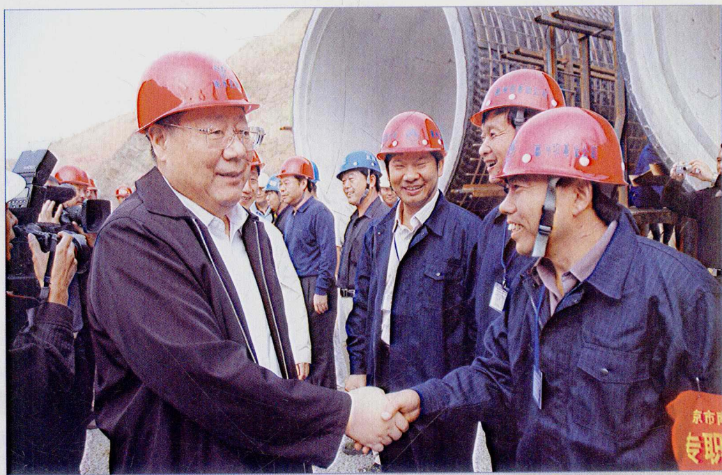
■ 2007年9月，国务院南水北调办主任张基尧考察南水北调中线一期京石段应急供水工程北京段工程建设情况。