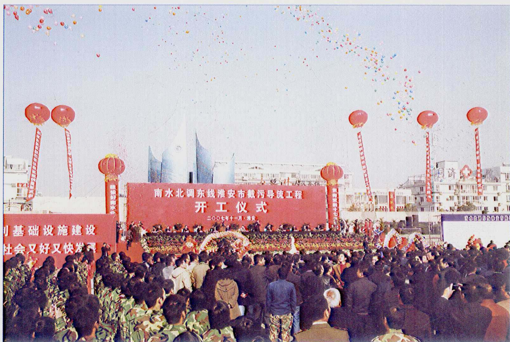
■ 2007年11月，南水北调东线一期工程淮安市截污导流工程开工建设。