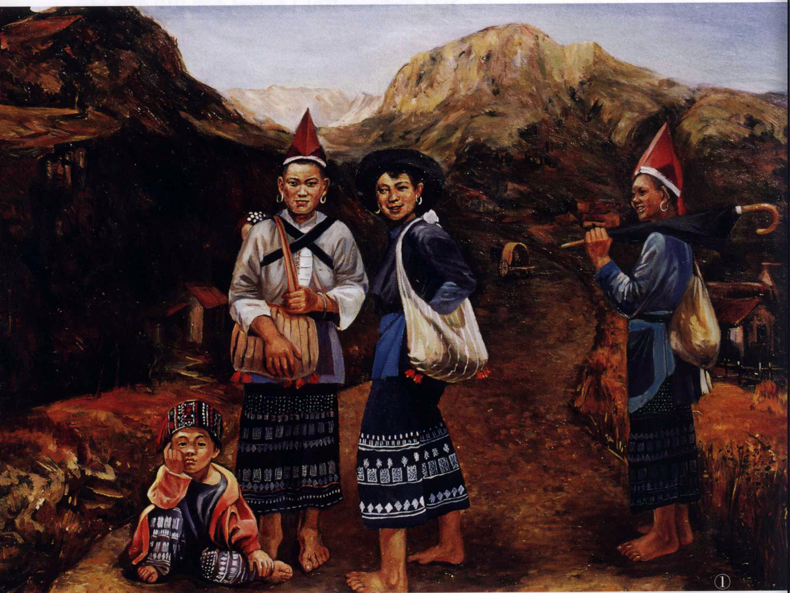
布面 油画材料 《等车的瑶族妇女》130cm×98cm 彭善秀