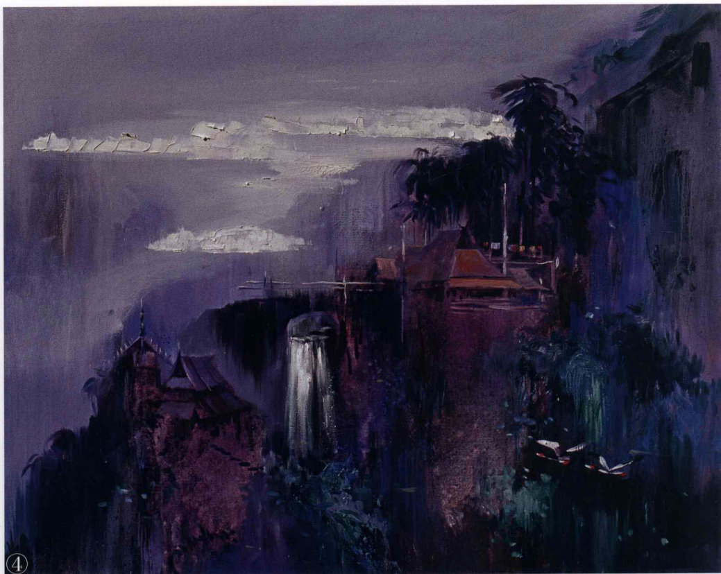
④ 布面 综合媒介剂 《布朗山上》100cm×80cm 彭善秀