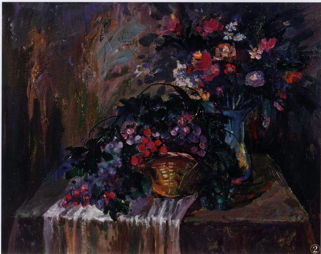
布面 油画材料 《静物》100cm×80cm 彭善秀