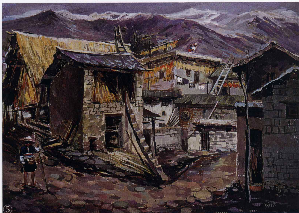
⑤ 纸本 水粉画材料 《曼秀老寨》50cm×30cm 彭善秀