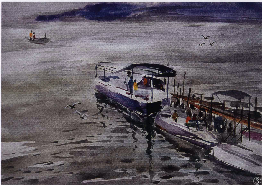
水彩纸 水彩画材料 《滇池边》50cm×30cm 彭善秀